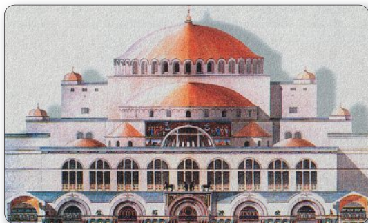
▲ Храм Святой Софии. Макет

5. Архитектура и живопись. В Византии, как и в древности, строились величественные здания и храмы, широкие площади городов были украшены статуями и фонтанами. Архитектура и живопись, музыка и литература прославляли деяния Бога и правителей Византии.