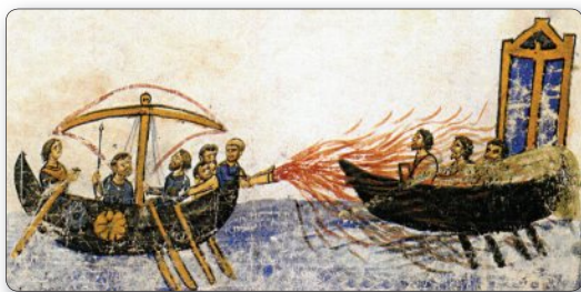
▲ Греческий огонь. Миниатюра XI в.

Византийская наука не знала себе равных в Европе. Византийские ученые достигли выдающихся успехов в математике, географии, астрономии, медицине и многих других науках.