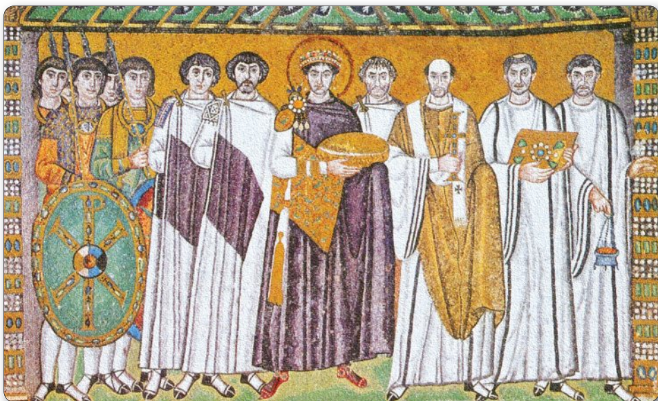
▲ Император Юстиниан со свитой. Мозаика в Равенне. VI в.

Высшим достижением византийской архитектуры является храм Святой Софии (Премудрости Божией) в Константинополе. Особенно поражали внутреннее убранство храма и его, словно парящий в потоках солнечного света, купол.