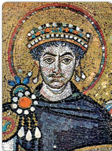
▲ Император Юстиниан. Мозаика в Равенне. VI в.