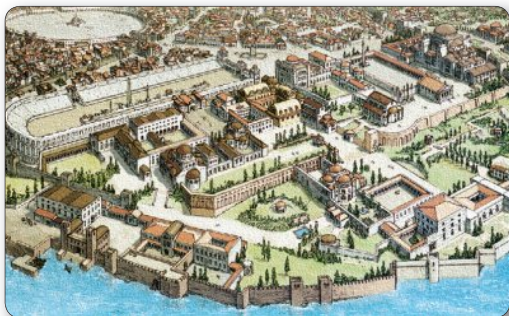
▲ Вид Константинополя. Макет

три раза в год. В отличие от Западной Европы в Византии переживали расцвет города. В них были развиты всевозможные ремесла.