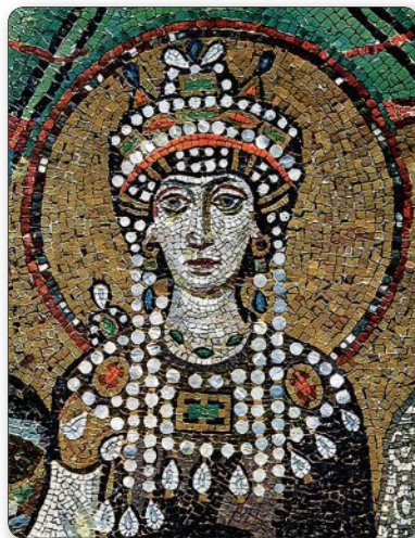
▲ Императрица Феодора. Мозаика в Равенне. VI в.

Наибольшего могущества Византийская империя достигла при императоре Юстиниане (527—565). Его отличали большой ум и сильный характер. Став императором, он приказал собрать и переработать римские и византийские законы. Сборник получил название «Кодекс Юстиниана». Законы «Кодекса» защищали жизнь и достоинство людей, регулировали их отношения.