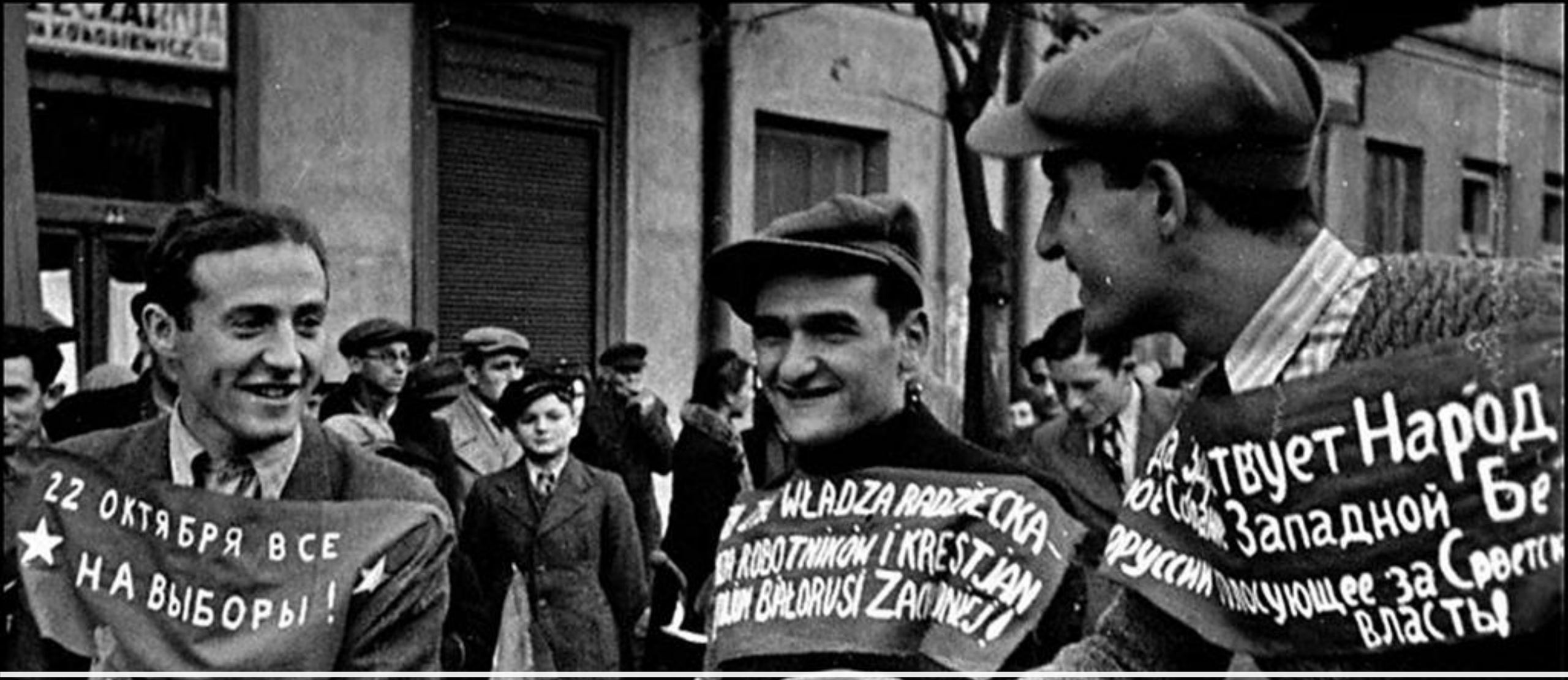
22 октября 1939 г. — выборы в Народное собрание Западной Беларуси