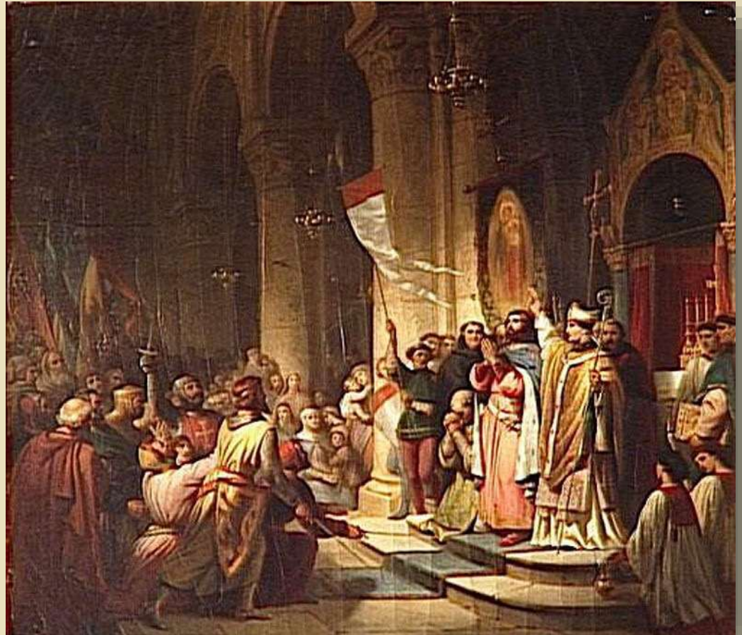
Провозглашение Флорентийской унии. 1439 г.

1453 г. – падение Византийской империи, после чего многие автокефальные (самостоятельные) православные церкви отказались от объединения с католической церковью