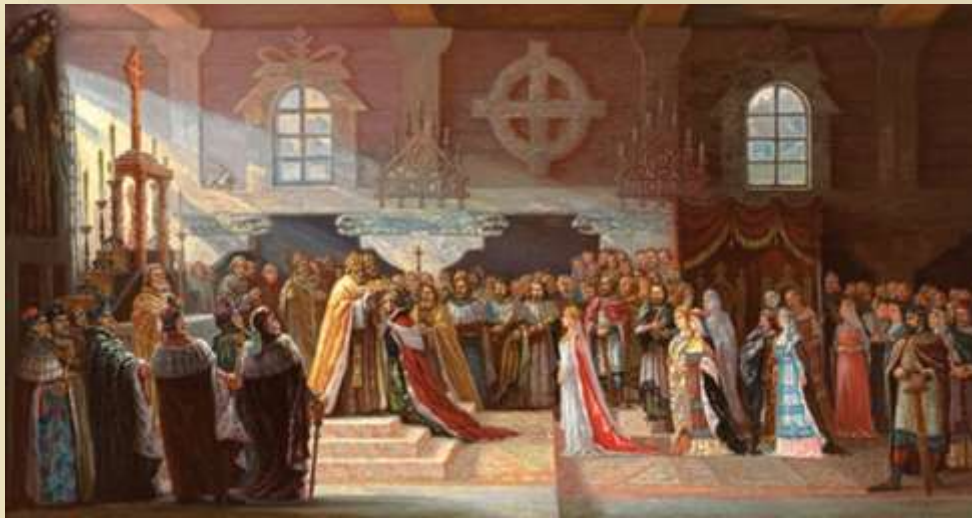
Коронация Миндовга. Худ. А.Варнас

В 1253 г. Миндовг короновался королём и принял католичество