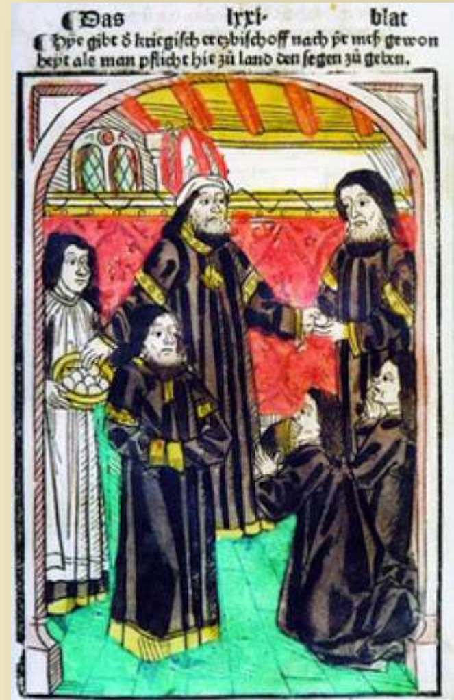
Митрополит Григорий Цамблук причащает верующих. Гравюра

1418 г. – посольство ВКЛ во главе с киевским митрополитом Григорием Цамблаком посетило Констанц (Германия), где обсуждался вопрос о церковной унии