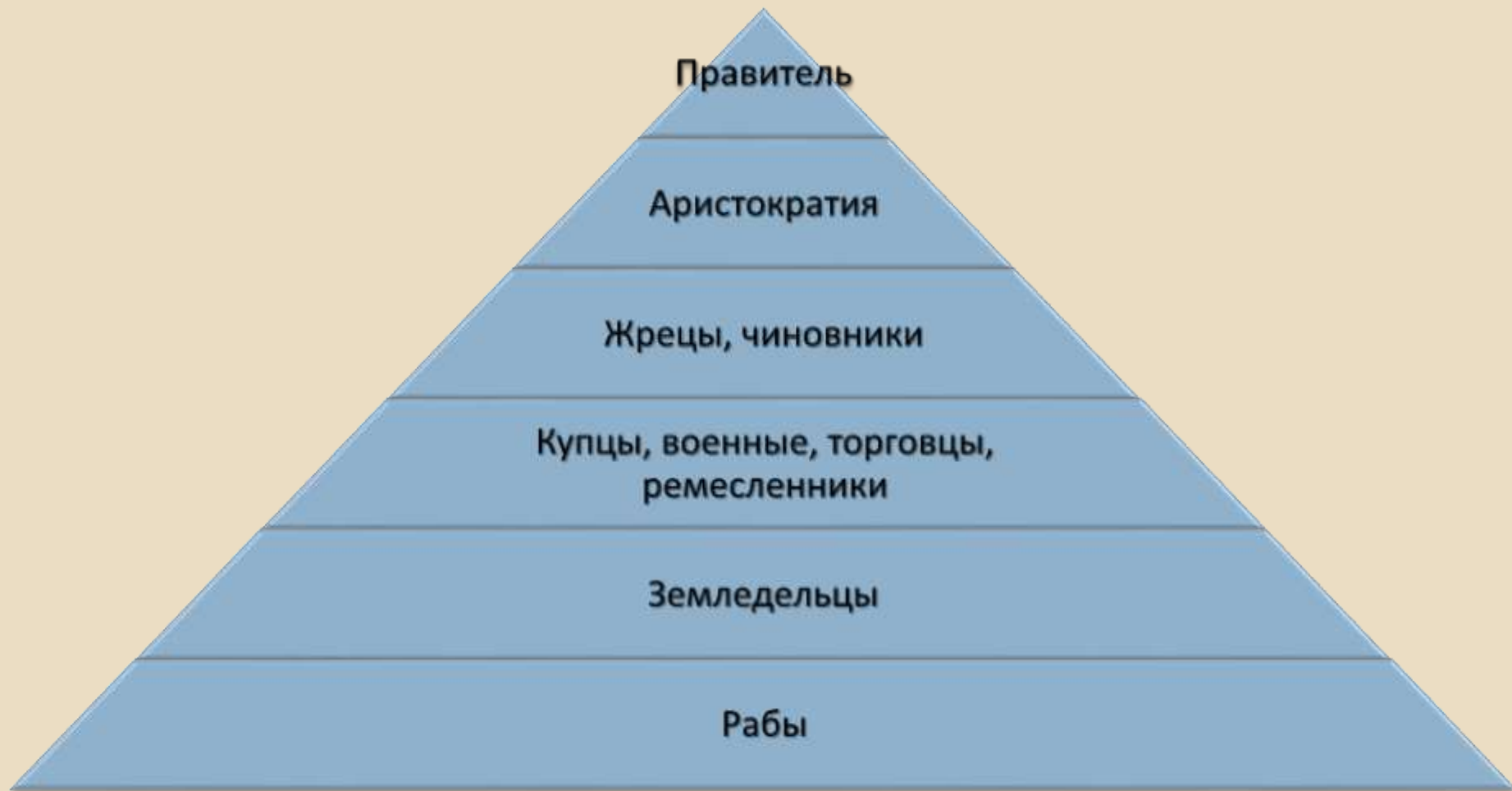
Структура древневосточного общества