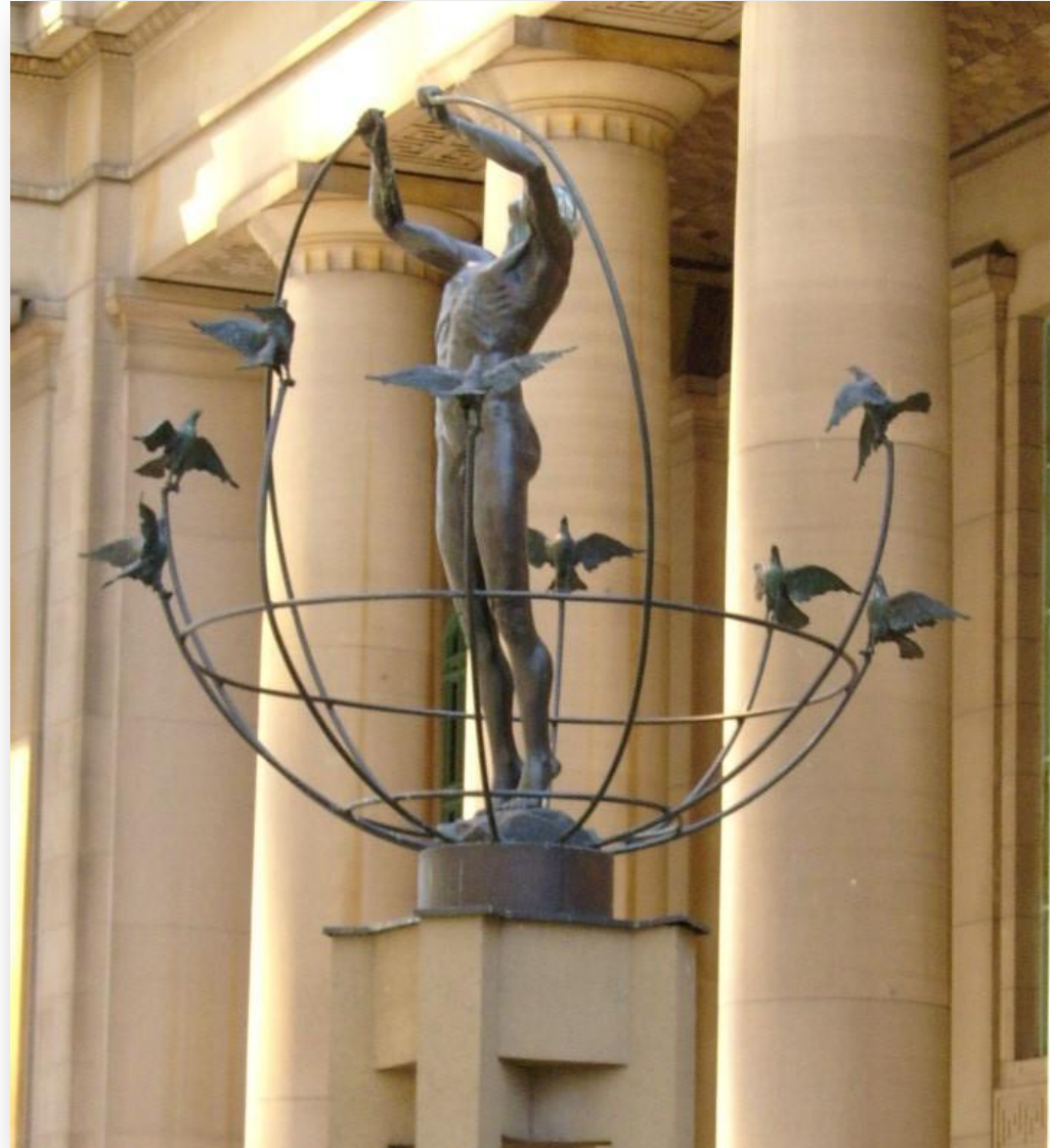
Монумент мультикультурализму в Торонто