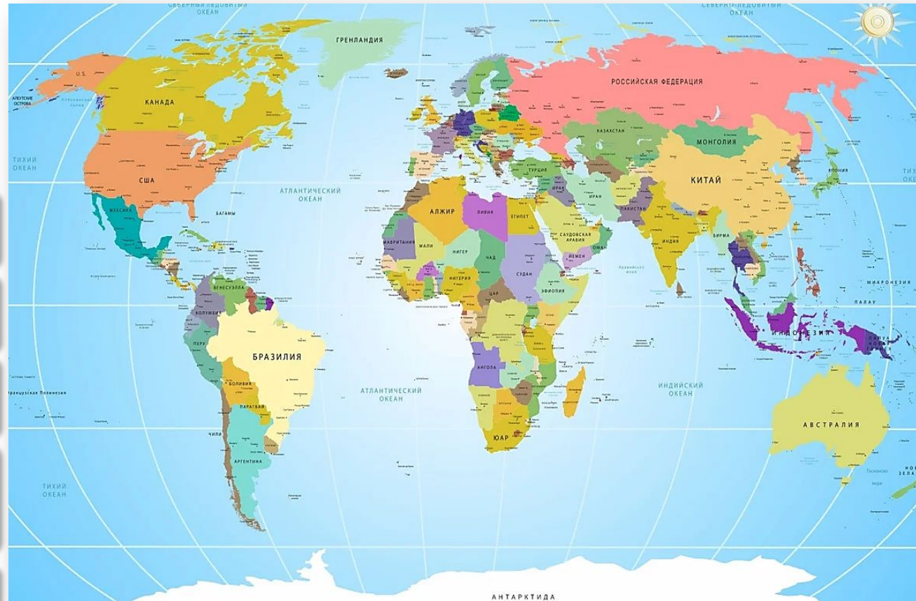
Политическая карта мира