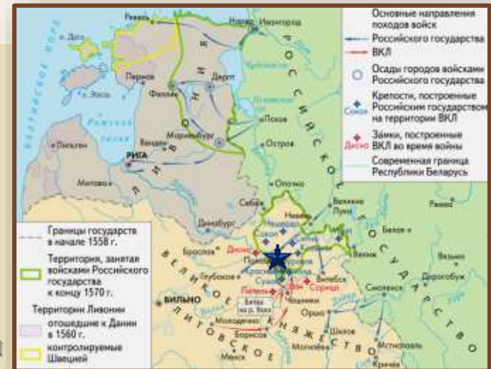
Ливонская война. Первый этап

Ливонская война, начатая в 1558 г. московским царём Иваном IV, затронула интересы ВКЛ. Успехи русских войск в Прибалтике вынудили магистра Ливонского ордена подписать с ВКЛ соглашение о присоединении Ливонии к ВКЛ в качестве провинции. Тогда военные действия были перенесены на территорию современной Беларуси. Московская армия в 1563 г. захватила Полоцк и часть Подвинья. ВКЛ требовался союзник. Им стала Польша.