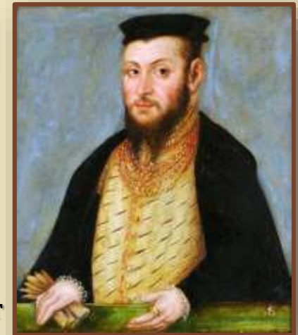
Сигизмунд II Август

Инкорпорация – включение в состав, присоединение