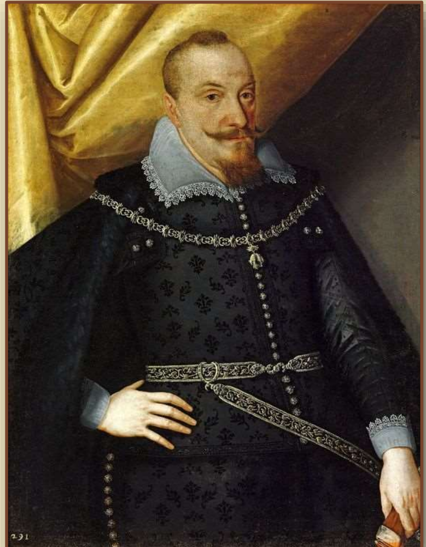
Сигизмунд III Ваза