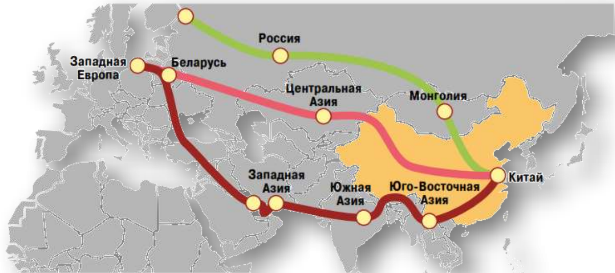
Новый Шёлковый путь

Новый шёлковый путь (Евразийский сухопутный мост) – концепция новой панъевразийской транспортной системы, продвигаемой Китаем, для перемещения грузов и пассажиров по суше из Китая в страны Европы