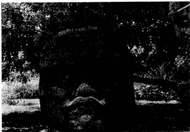
Характерная для цивилизации ольмеков скульптура — гигантская голова.

Лица очень реалистичны: чуть раскосые миндалевидные глаза, широкий приплюснутый нос с вывернутыми ноздрями, полные щёки, пухлые губы, иногда загнутые вниз, округлый подбородок. Черты каменных изваяний никак не вписываются в представления о современной внешности индейцев. Они скорее напоминают внешний облик африканцев. Некоторые исследователи предполагают, что предки ольмеков приплыли в Америку из Западной Африки. Для этих скульптур характерны плотно прилегающие к голове головные уборы, похожие на шлемы или каски, край которых почти доходит до глаз, с ремешком под подбородком. Бокковые пластины на шлеме надвинуты на уши, мочки которых украшены ушными вставками и крупными серьгами.