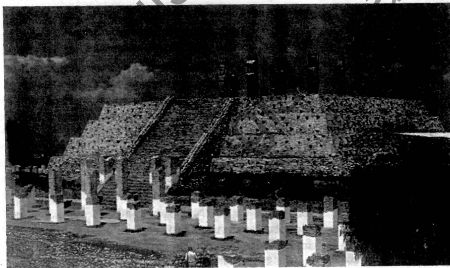
Пирамида Кецалькоатля в Туле, городе, который был одним из первых урбанистических центров Мезоамерики.

Учитель. Что собой представляла цивилизация ольмеков? Историки считают, что это были города с округами, которые всегда располагались возле рек. Сейчас археологи обнаружили около 10 подобных центров. Самыми крупными из них исследователи считают Сан-Лоренсо (1350—700 гг. до н. э.), Ла-Вента (1000—400 гг. до н. э.), Трес