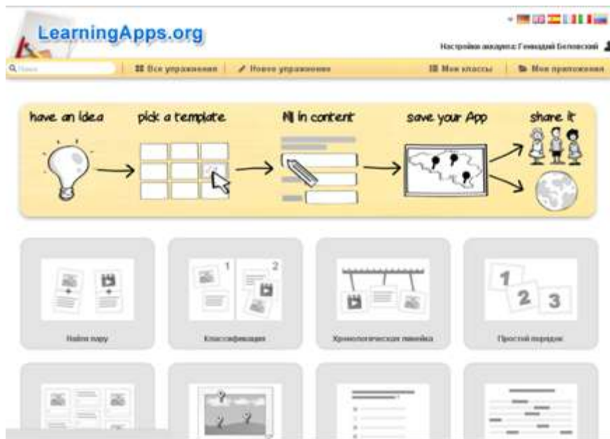
Рис. 3. Выбор нового упражнения