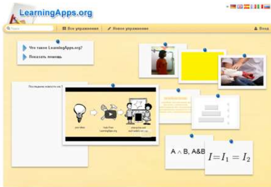
Рис. 1. Главная страница сайта

Просмотрите несколько заданий различного типа