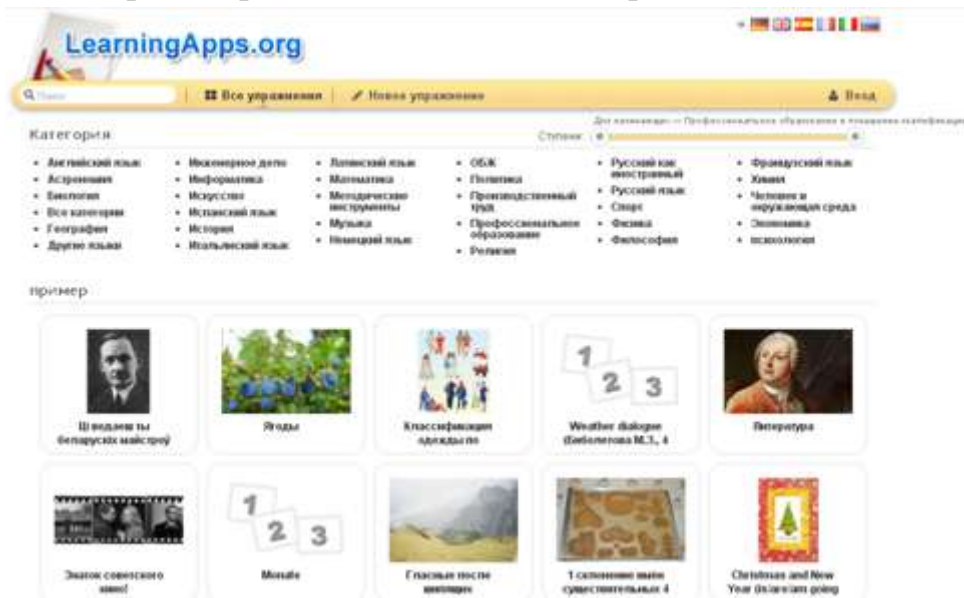
Рис. 2. Все упражнения

Просмотрите несколько заданий различного типа