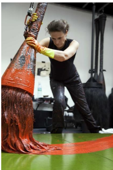
Fabienne Verdier dans son atelier, en train de réaliser l'œuvre Ascèse du 02 février .