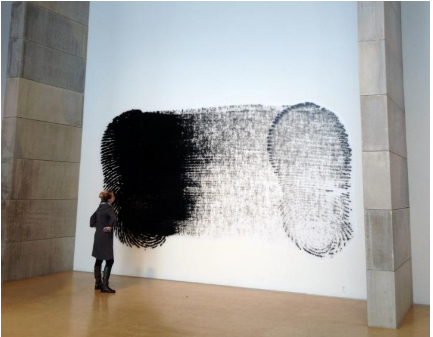
Evan Roth, Slide to Unlock , Impression sur vinyle, 2014, 600cm x 450cm. Peinture créée en exécutant des tâches de routine sur des appareils informatiques portables multi-touch.