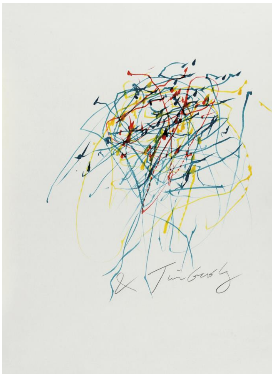
TINGUELY Jean (1925-1991), Dessin Méta-Matic , encre sur papier, 1959.