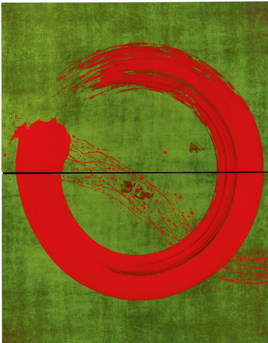
Fabienne Verdier, Ascèse du 02 février , 2009, Serie: "Silencieuse Coïncidence", encre, pigments et vernis sur toile, 250 x 183 cm