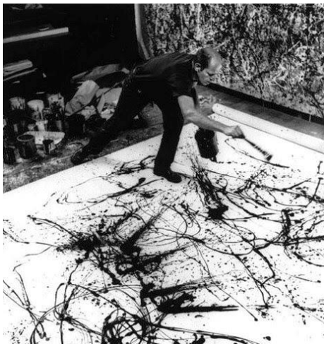
Hans Namuth, Jackson Pollock au travail dans son atelier (détail) , 1950, photographie