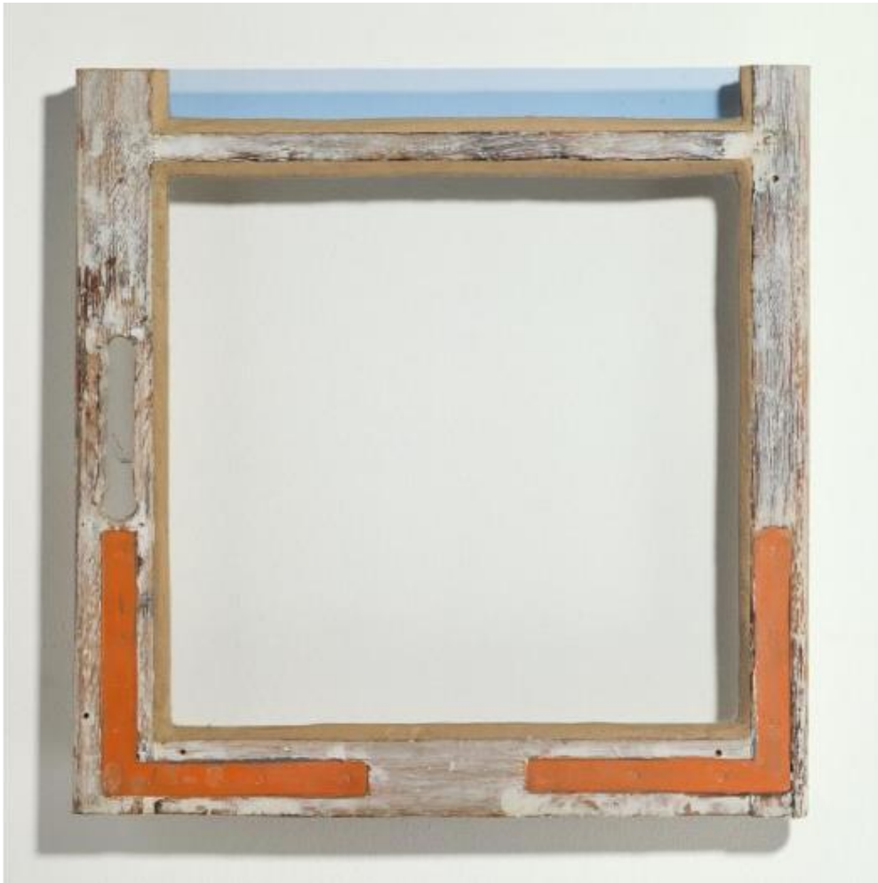
Pierre Buraglio (1939 - ), Fenêtre (Fenêtres), 1977

Bois, verre incolore, verre bleu, fer passé au minium, 54,3 x 52,7 x 3 cm