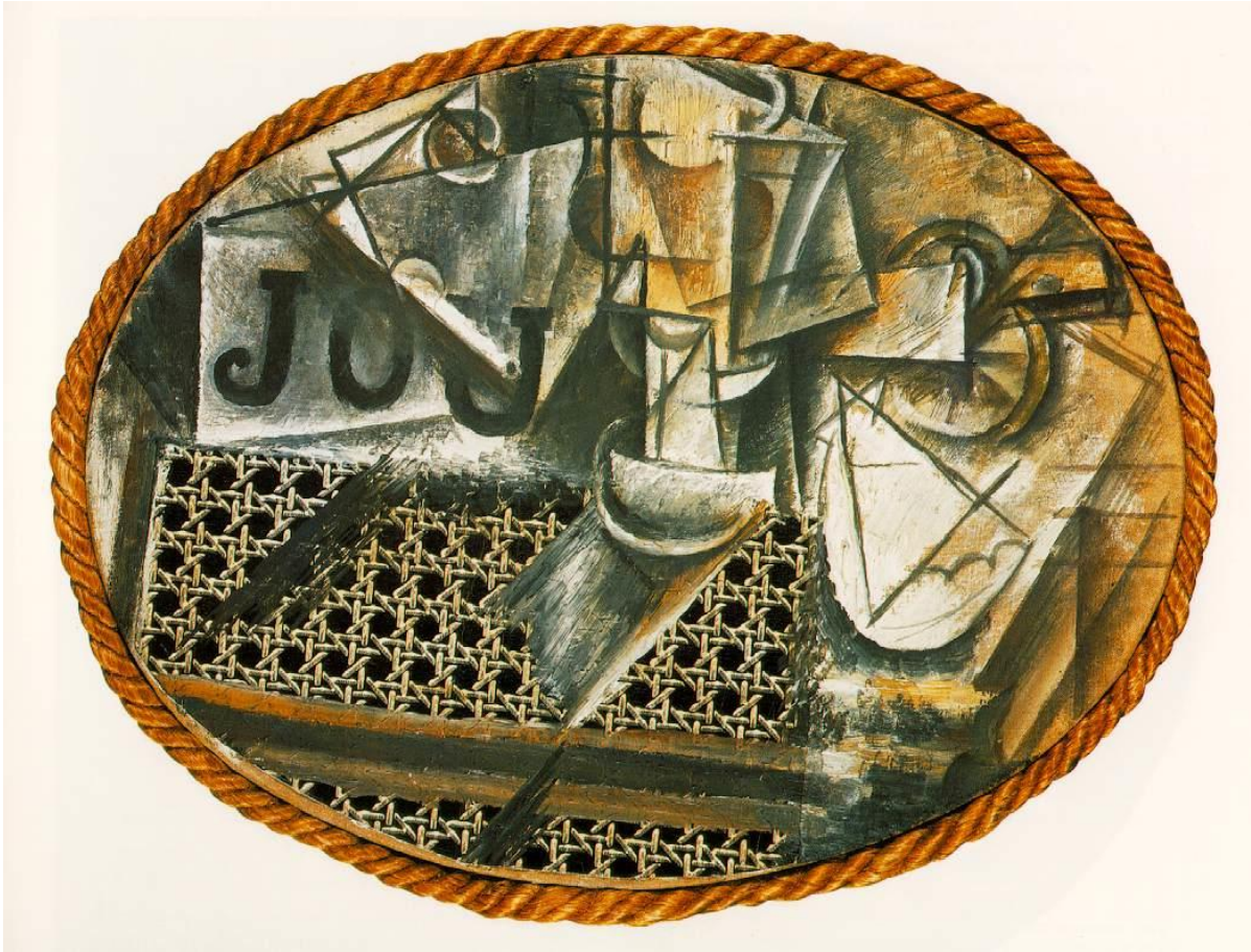
Pablo Picasso, Nature Morte à la chaise cannée, 1912 peinture à l'huile et toile cirée sur toile, corde, 27x35 cm, Musée Picasso, Paris