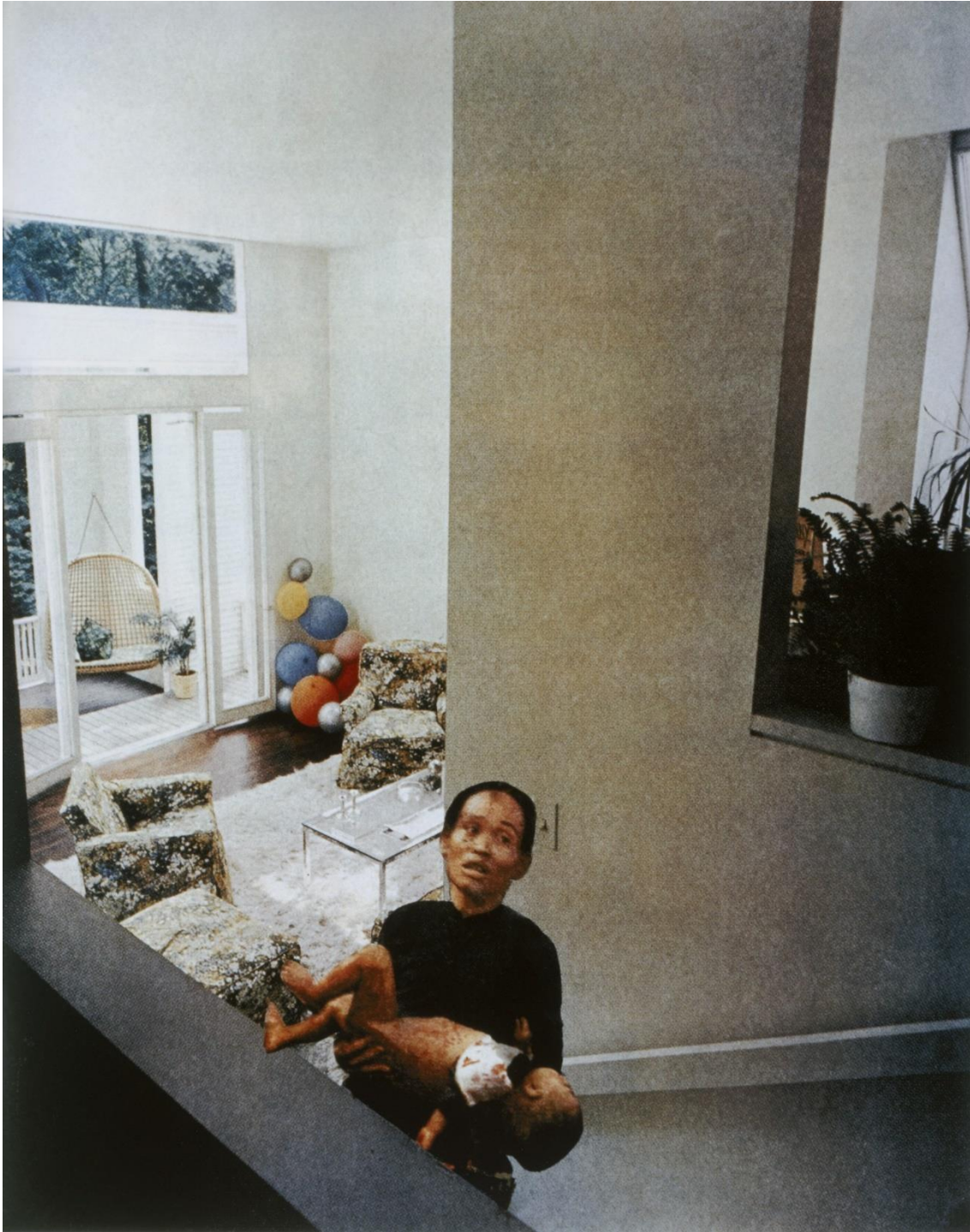
Martha Rosler, Balloons de la série house beautiful : bringing the war home, 1967-72 photomontage, impression jet d'encre 2011, 60.2 × 47.9 cm, The Shaping of New Visions: Photography , MOMA.