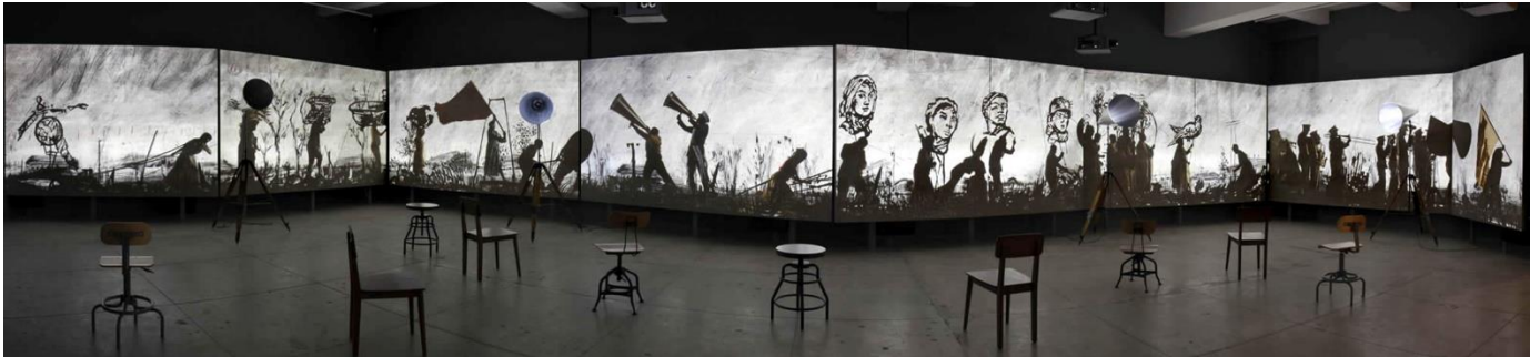
William Kentridge (1965-), More Sweetly Play the Dance (Jouer la danse plus doucement) , 2015, dimensions variables (entre 30 et 45 m), installation vidéo 8 canaux haute définition, 15 min, avec 4 porte-voix, Ottawa, musée des beaux-arts du Canada.