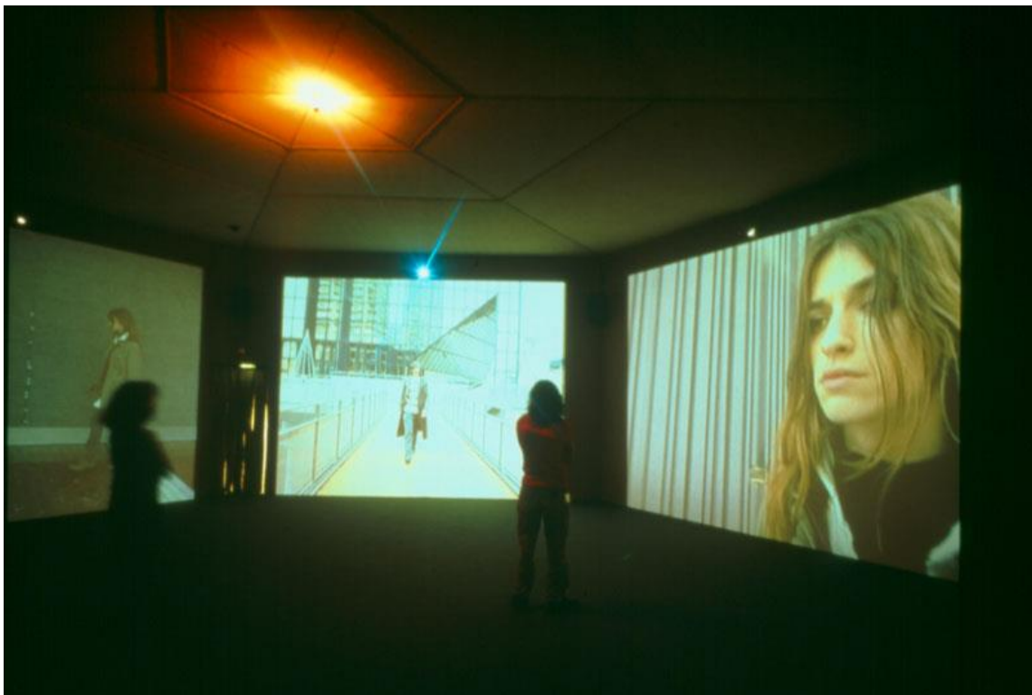
Ugo Rondinone, Roundelay , installation vidéo, 2003, 53 mn, installation avec 6 écrans et musique répétitive.- Round (circularité) et Delay (retard)