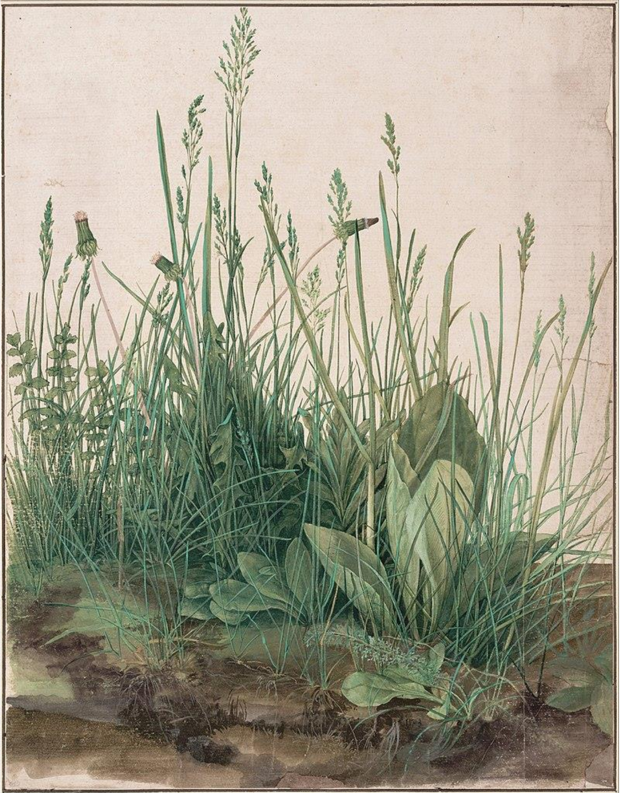
Albrecht Dürer , Grande touffe d'herbe , 1503, aquarelle sur papier, 41x31,5 cm