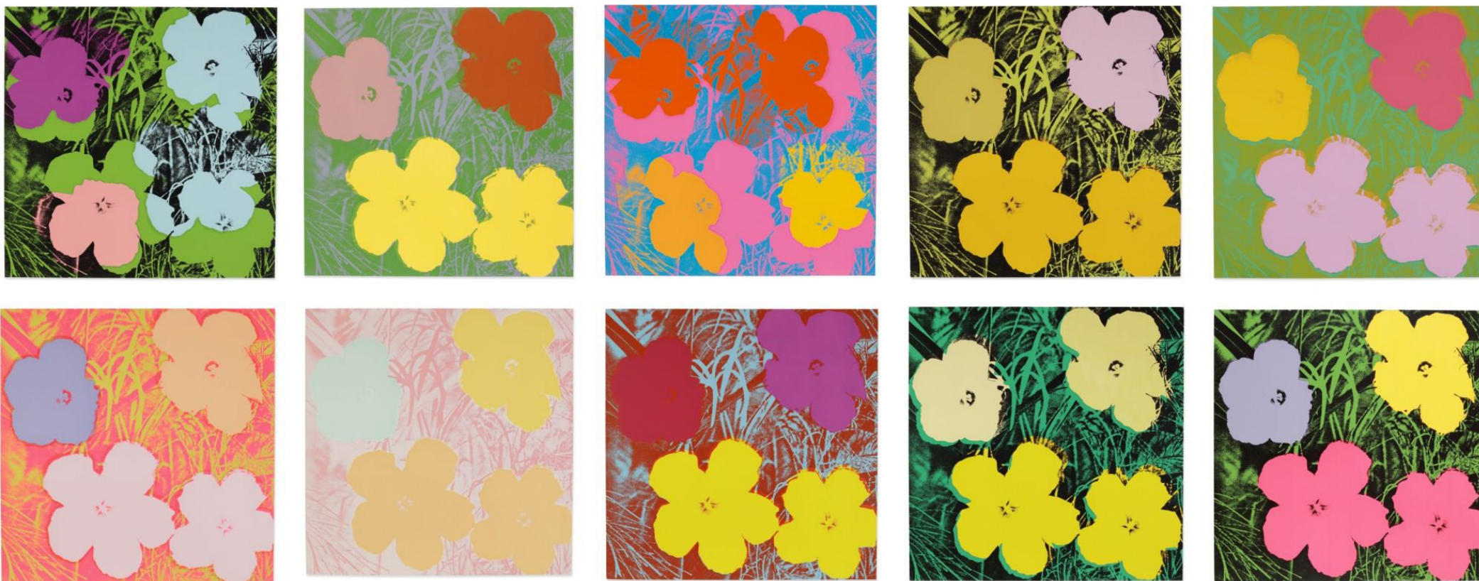
Andy Warhol (1928 – 1987) Flowers , série de 10 sérigraphies et acrylique sur toile, 100x100 chaque