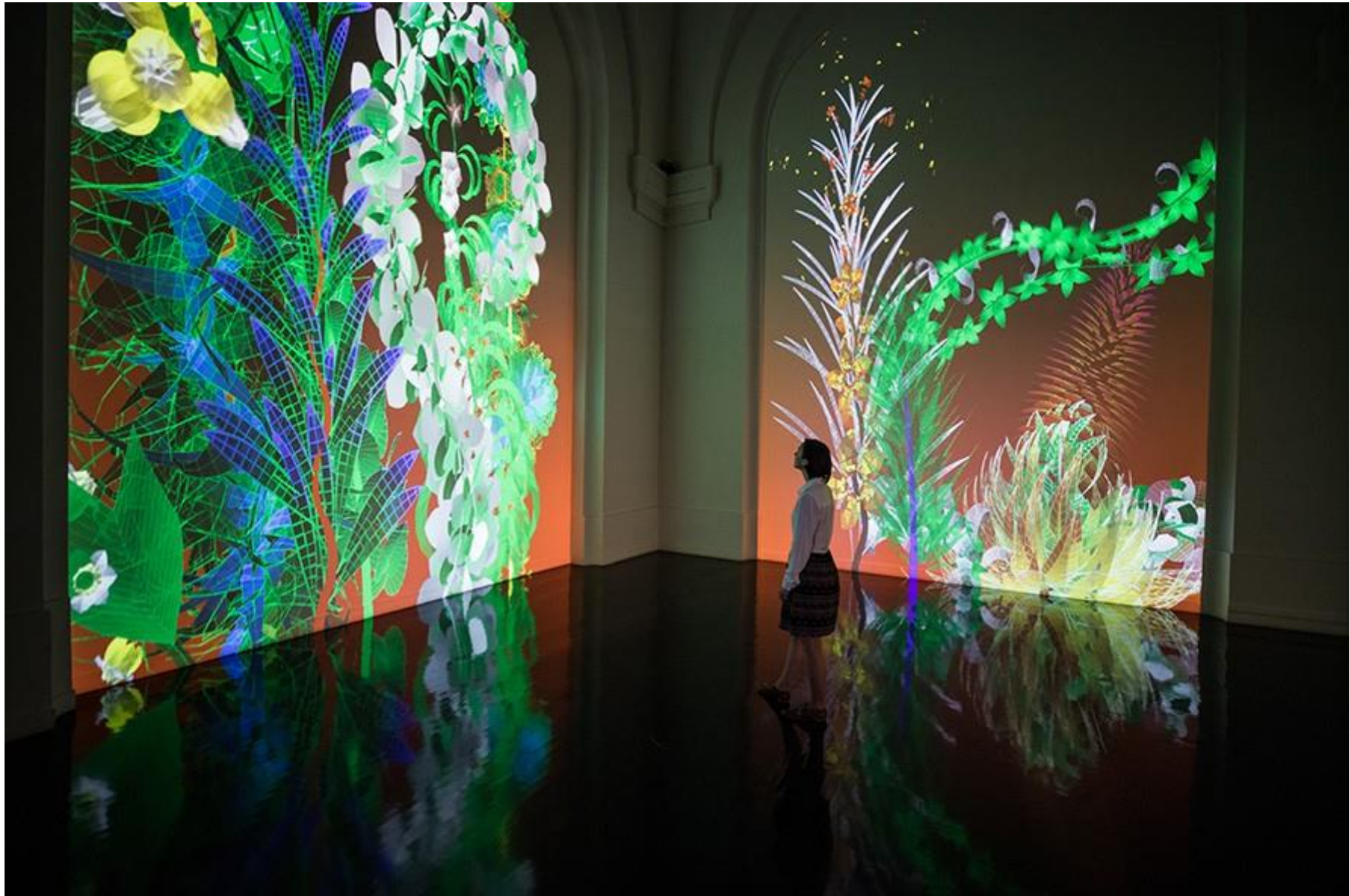
Miguel Chevalier, Extra-Natural 2018 , installation projection interactive, Logiciel : Cyrille Henry / Antoine Villeret, Galeries nationales du Grand Palais, Paris (France), Exposition collective: Artistes et Robots

https://www.youtube.com/watch?v=QeRZZH8pSOU