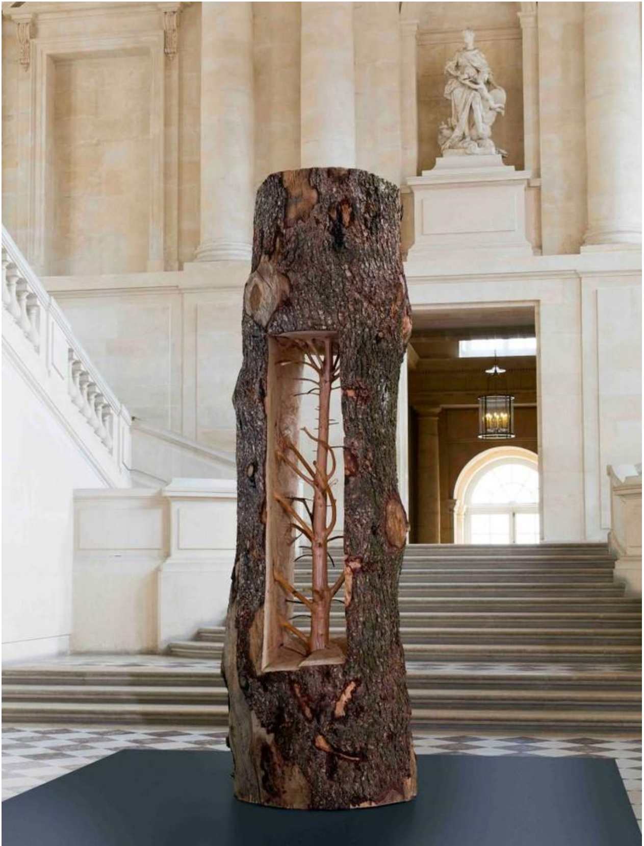
Giuseppe Penone, Albero Porta cedro (arbre porte cèdre) , 2012, tronc sculpté, Château de Versailles