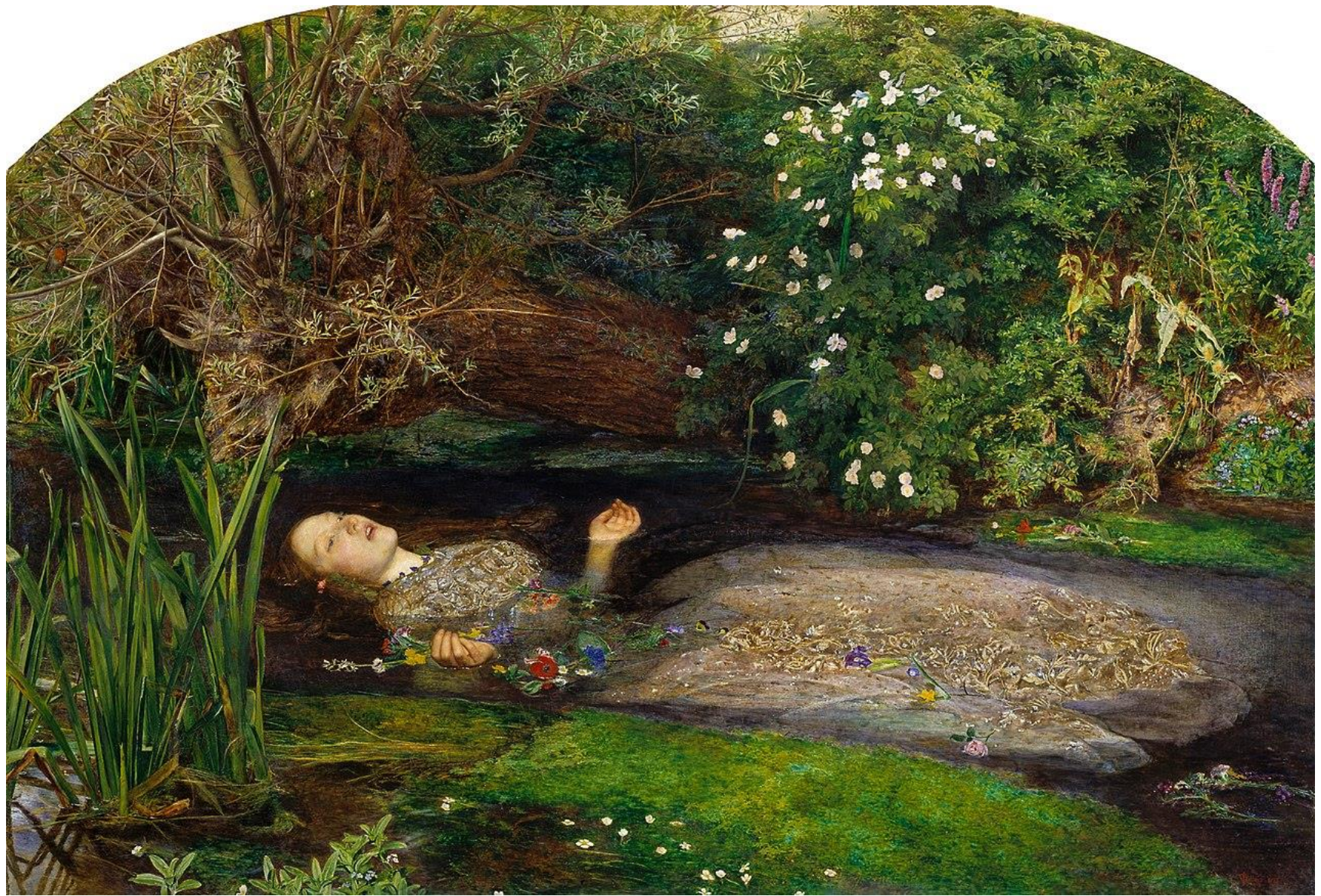
John Everett MILLAIS, Ophélie , 1851-1852, huile sur toile, 76 x 111 cm