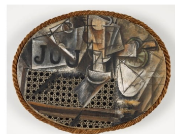
Picasso, Nature morte à la chaise cannée