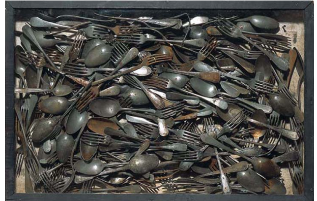
ARTERIOSCLEROSE, Arman, 1961

Fondé en 1960, il rassemble des artistes comme Yves Klein, Arman, Jean Tinguely, César ou encore Jacques Villeglé. Le dénominateur commun de ces artistes est le recours aux objets sous forme d'assemblages, d'accumulations ou de compressions. Les objets ainsi piégés s'exposent comme des reliques de notre société. Ainsi exposés, ils sont également détournés de leur finalité initiale et tendent à nous faire réfléchir sur l'usage que nous en faisons au quotidien et sur nos modes de vie.