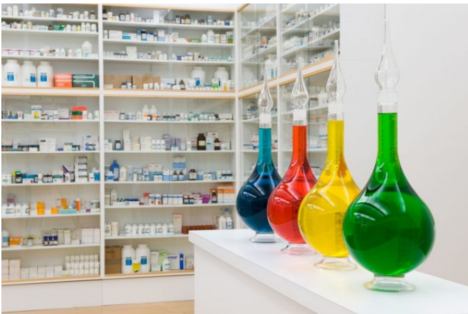
Pharmacy, Damien Hirst