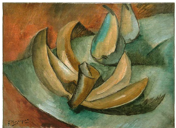
Georges Braque, cinq bananes et deux poires , huile sur toile