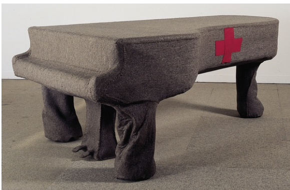
Joseph Beuys, Infiltration homogène pour piano à queue, 1966 Piano à queue recouvert de feutre et tissus, 100 x 152 x 240 cm

Joseph Beuys, artiste allemand de l'après guerre assemble Objets et matériaux liés à une symbolique toute personnelle ancrée dans sa biographie participant d'un art à visée sociale dans une société malade.