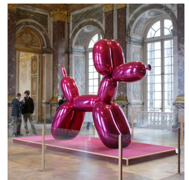
KOONS Jeff (né en 1955), Balloon-dog (Ballons en forme de chien), Magenta, 1995-2000, acier chromé inoxydable