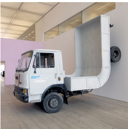
WURM Erwin (né en 1954), Truck (Camion), 2005.