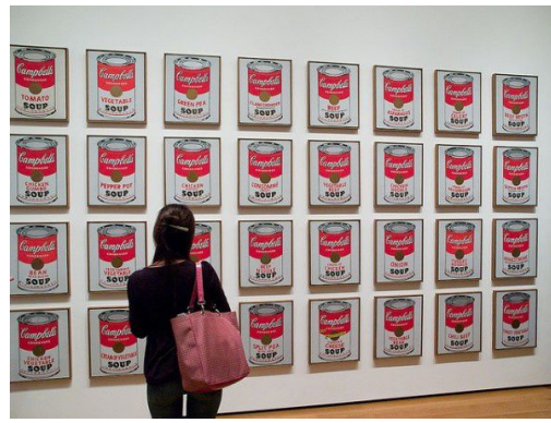
Andy Warhol, "Campbell's Soup Cans" (1962), Acrylique et liquitex en sérigraphie sur toile, série de 32 toiles de 50,8 x 40,6 cm chacune