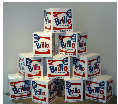
Brillo boxes, Andy Warhol, 1964

L'objet en tant que marchandise promu par la société de consommation se met en place, dans les années soixante, avec son langage publicitaire et ses mass-media. Déjà vers la fin des années cinquante, des artistes comme Robert Rauschenberg et Jaspers Johns avaient réagi contre les derniers sursauts de l'Expressionnisme abstrait , trouvant dans l'esprit antiacadémique de Dada et dans la figure de Duchamp leurs inspireurs . Ces artistes prônent un retour au réel et si Rauschenberg intègre dans ses immenses tableaux, les Combine-paintings , des objets usagés de toutes sortes (journaux tabourets, lits, bouteilles de Coca, etc.), Johns réalise des peintures du drapeau américain ou des cibles de tir qui sont des peintures littérales de l'objet en question.