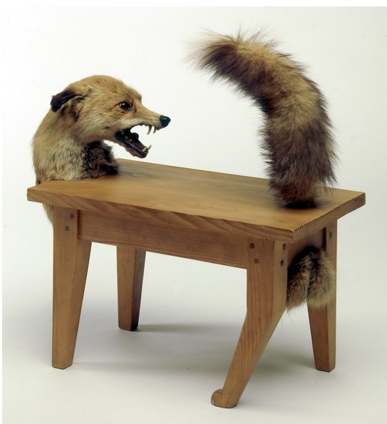
Victor Brauner, Loup-table , 1939-1947 Bois et éléments de renard naturalisé