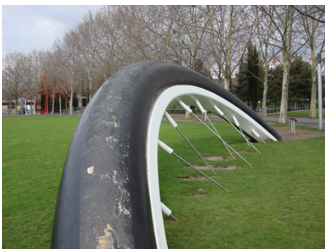
OLDENBURG Claes (né en 1929), Buried bicycle (Vélo enterré), 1990, détail, roue de 2,8x16,3x3,2 m, Paris, Parc de la Villette.