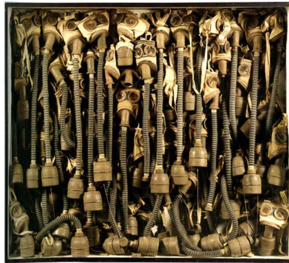
César, sans titre, compression d'objets