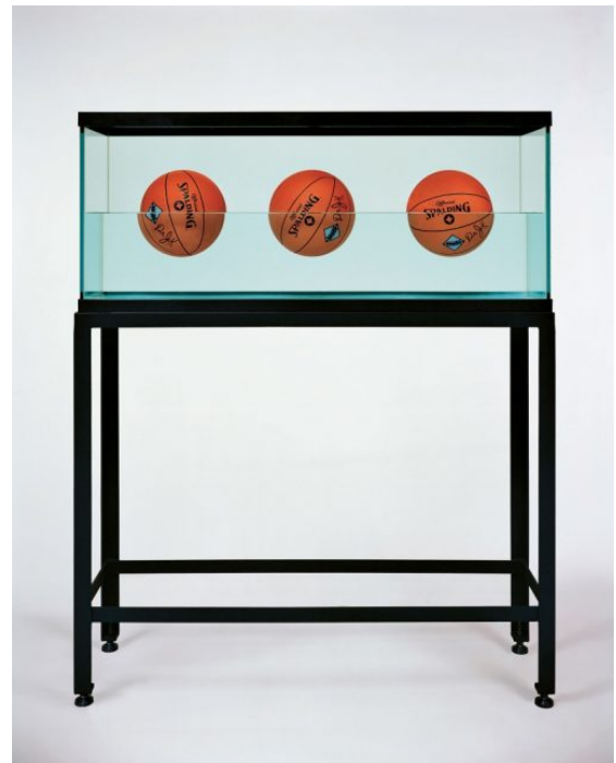
Three Ball 50-50 Tank, Jeff Koons, 1985