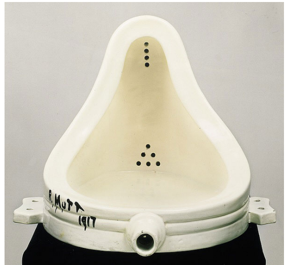
Marcel Duchamp, Fontaine, 1917

L'objet quotidien manufacturé devient œuvre d'art par la seule déclaration de l'artiste et par son implantation dans une galerie, sur un socle. De 1917 date son ready-made le plus connu, le célèbre urinoir retourné et rebaptisé Fontaine . Présenté au salon des indépendants, à New York, sous un pseudonyme (R Mutt), le jury dont il fait lui-même partie le refuse, scandale par lequel commencent l'épopée et le succès des ready-made.