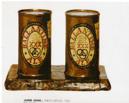
JOHNS Jasper (né en 1930), Painted bronze, 1960, huile sur bronze, 14x20,3x12,1 cm, Bâle, Kunstmuseum