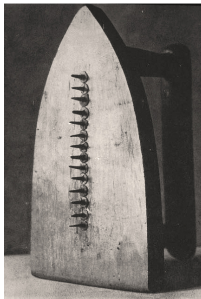
MAN RAY (1890-1976), Le cadeau , 1921 - 1972, fer à repasser et 14

s'étant particulièrement intéressés à l'objet, le Dictionnaire abrégé du Surréalisme propose une panoplie d'objets artistiques : objets réels et virtuels, objet mobile et muet, objet onirique, objet fantôme , etc. Ce qui réunit ces différentes déclinaisons de l'objet est leur charge inconsciente et symbolique, l'appel à une surréalité que les surréalistes trouvaient plus réelle que le réel lui-même.