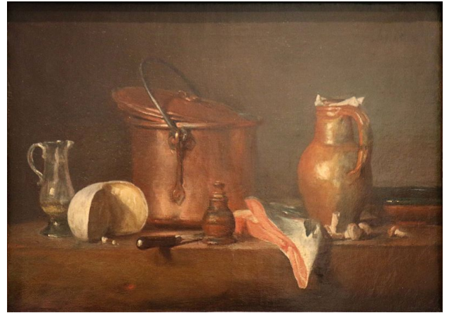
Jean Simeon Chardin, Nature morte , huile sur toile, env 1730

La représentation de l'objet et de l'espace avec les expériences cubistes chez Braque et Picasso notamment va bouleverser le champ de la peinture et de l'art plus généralement. La peinture cherche dès lors à représenter un espace et des objets dans toutes ses dimensions. Il s'agit de rendre l'espace et avant tout l'espace. C'est la période du cubisme analytique. Cette période clos aussi une histoire de la représentation de l'objet qui commence avec les natures mortes du XVI e siècle. Les cubistes, après Cézanne, vont épuiser leur sujet, ouvrant la peinture après eux à d'autres expérimentations, délaissant notamment la représentation du réel (voir les surréalistes par exemple).