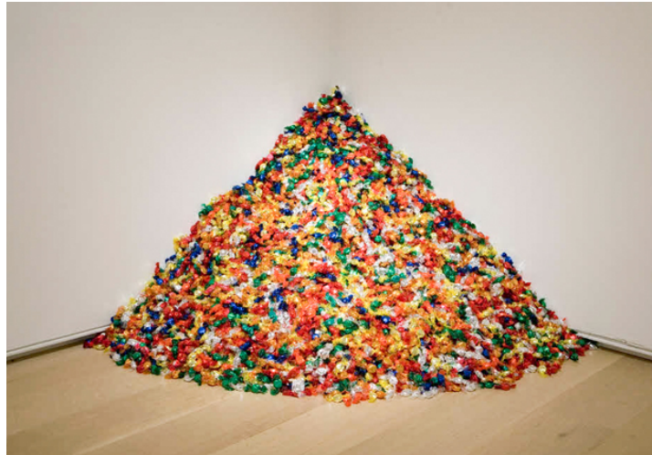
Untitled (Portrait of Ross in L.A.), Félix Gonzalez Torres, 1991