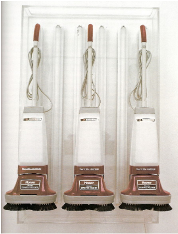
KOONS Jeff (né en 1955), New Hoover Deluxe Shampoo Polishers, 1986, aspirateurs alignés sous vitrine.

la production contemporaine continue de marcher dans les pas de Duchamp en poussant le procédé à l'extrême.