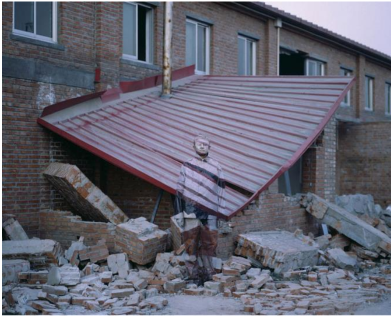
Liu Bolin, Hiding in the City (Se cacher dans la Ville) , Suojia Village, 2006, 126x160 cm, Galerie Paris-Beijing, Paris.