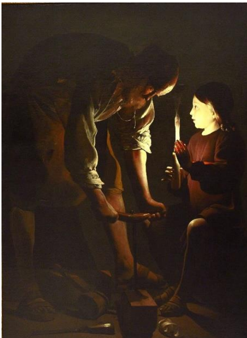
Georges De La Tour, Saint Joseph charpentier, 1638-1645, 137 x 102 cm, huile sur toile