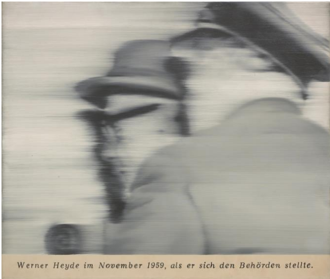
Gerhard Richter Herr Heyde (Monsieur Heyde) 1965 55 cm x 65 cm, Huile sur toile

Voir les œuvres de Gerhard Richter : https://www.gerhard-richter.com/fr/