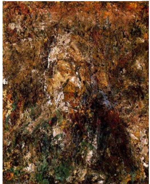
Eugène Leroy, Self Portrait, 1986, huile sur toile