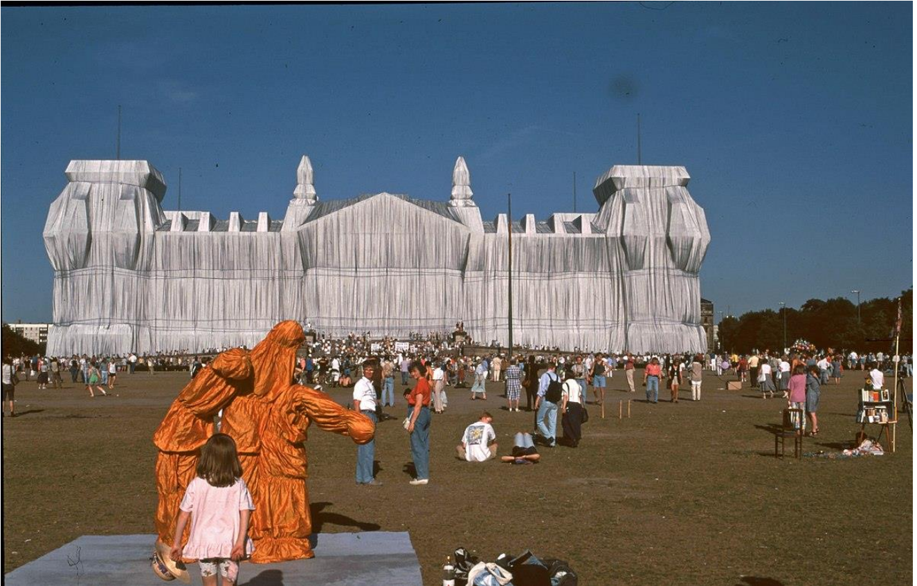
Christo, Emballage du Reichstag (parlement allemand), tissu, 1995