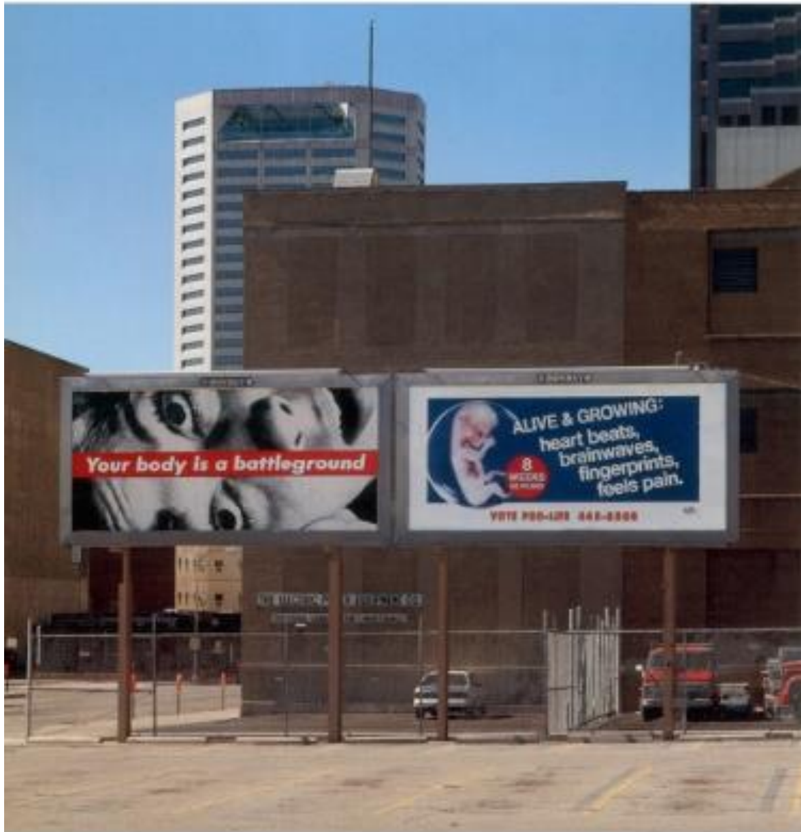
Barbara Kruger , Your Body is a Battleground , 1990. Billboard project, Wexner Center for the Arts, Columbus, Ohio