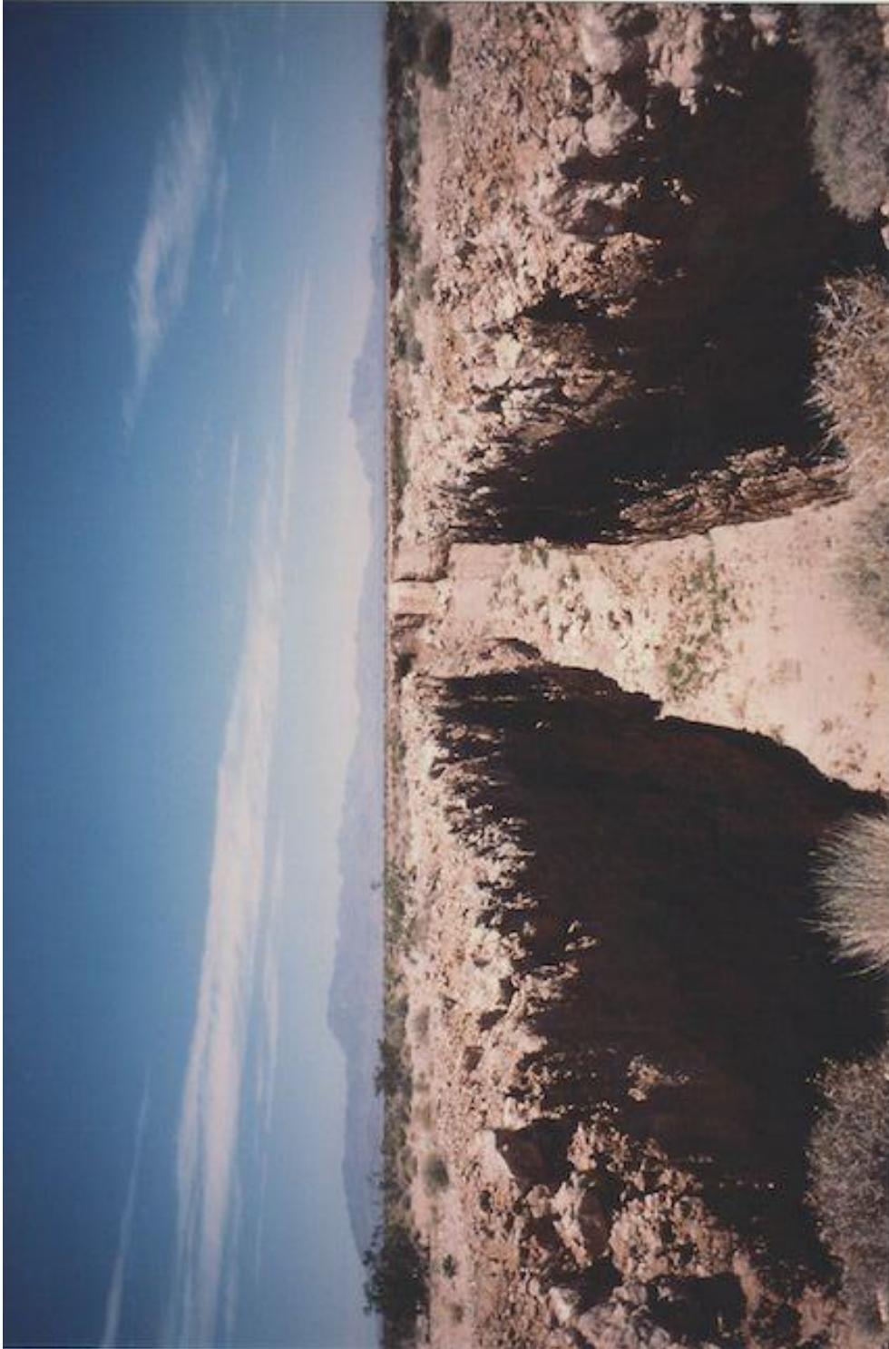
Michael Heizer, Double Negative , Déplacement de roches, 1969-1970, Nevada, Etats Unis,