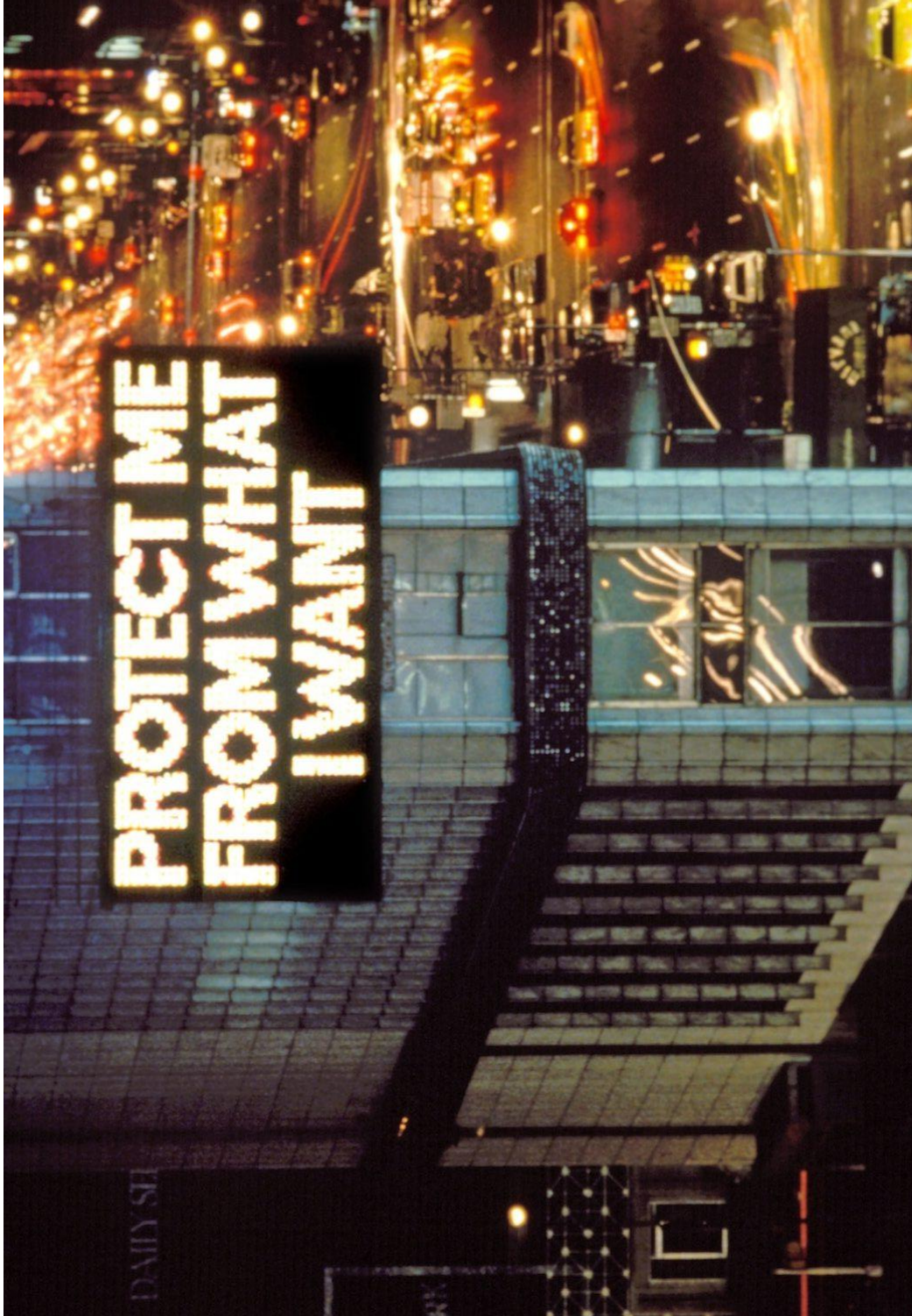
Jenny Holzer, Protect me from what I want, Survival (1983–85), 1985, panneau électronique, 6,1 x 12,2 m, Times Square, New York,