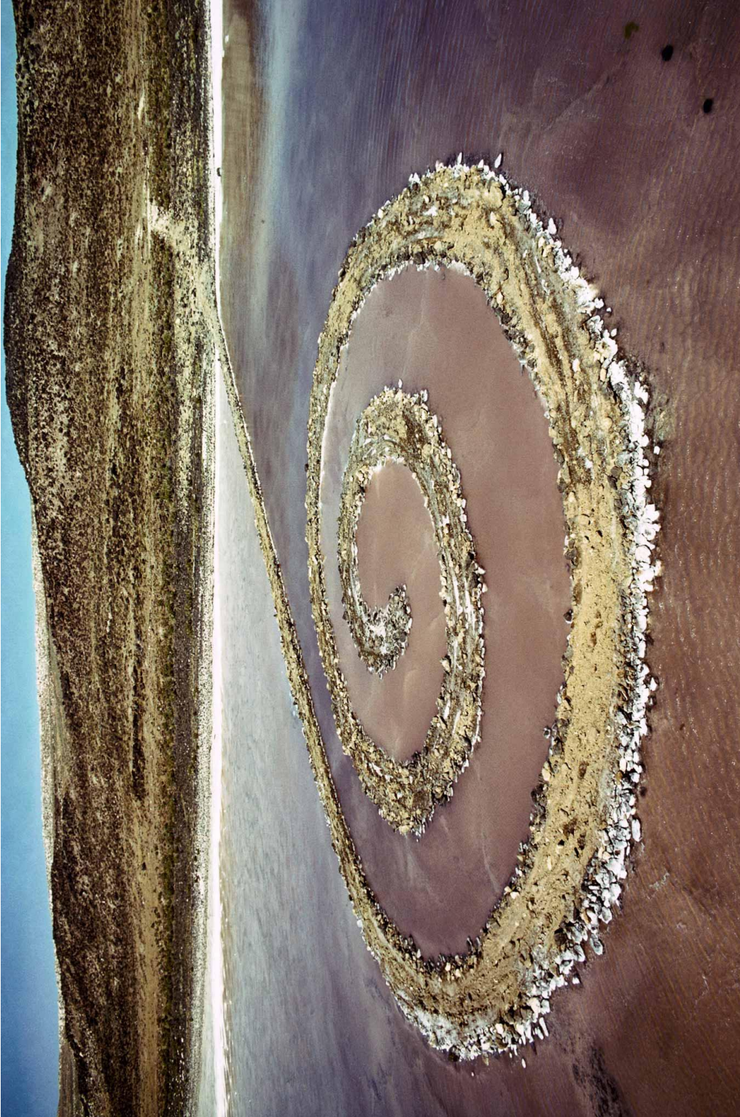
Robert Smithson, Spiral Jetty, Grand Lac Salé de l'Utah, 1970