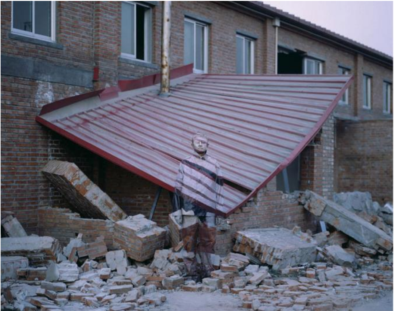
Liu Bolin , Hiding in the City (Se cacher dans la Ville) , Suojia Village, 2006, 126x160 cm, Galerie Paris-Beijing, Paris