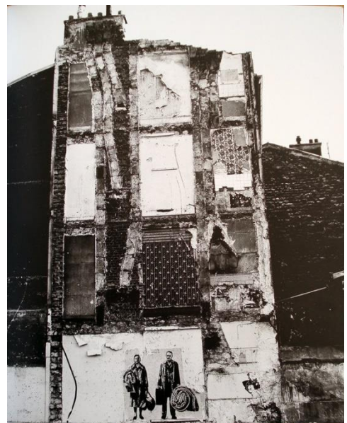
Vue générale de l'immeuble