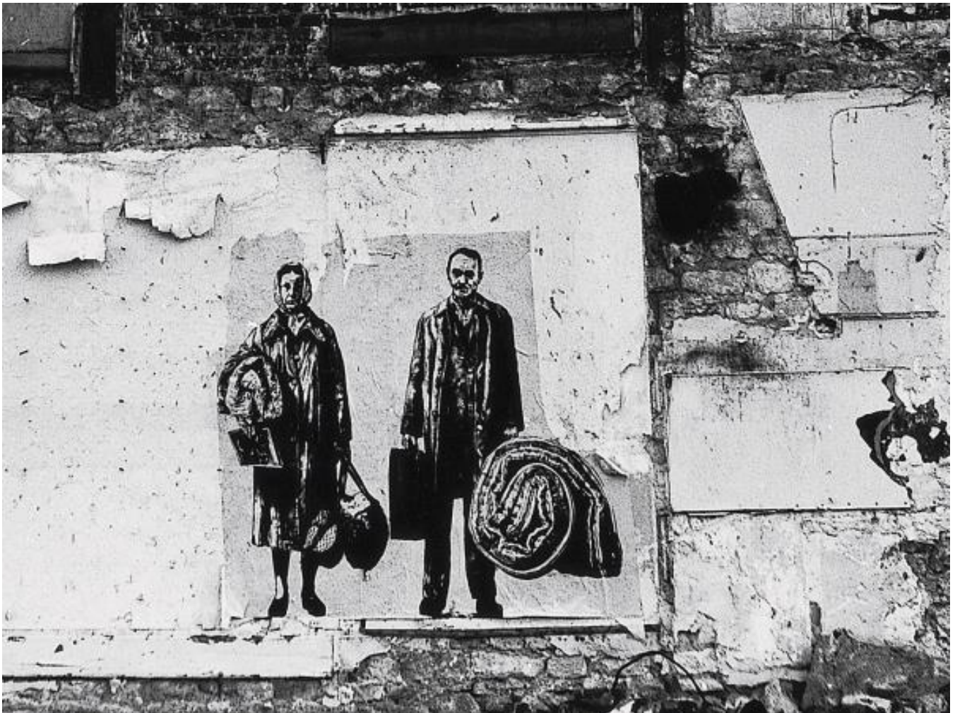
Ernest Pignon Ernest, Les expulsés , sérigraphie in situ, 1977-79, Paris