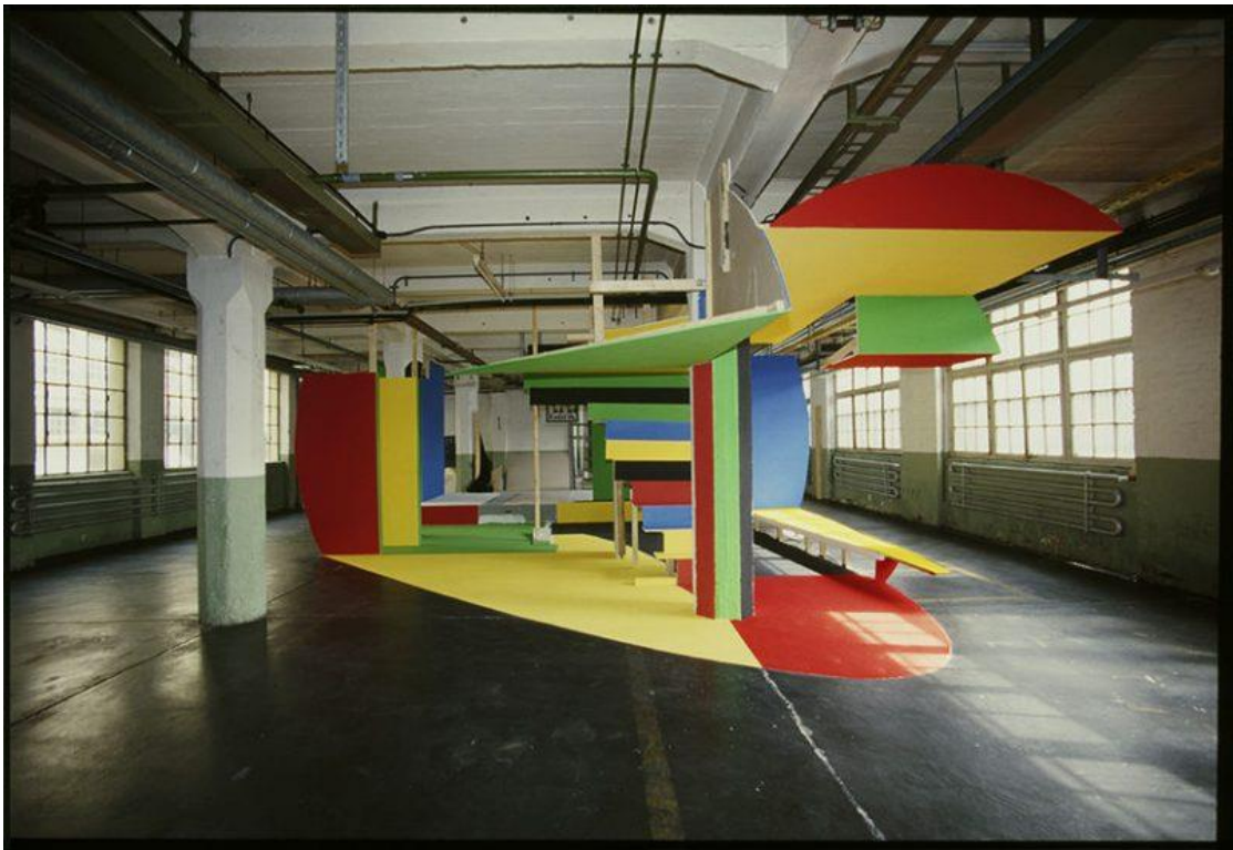
Georges Rouse , sans titre, installation picturale, 2003, Rüsselsheim, Allemagne