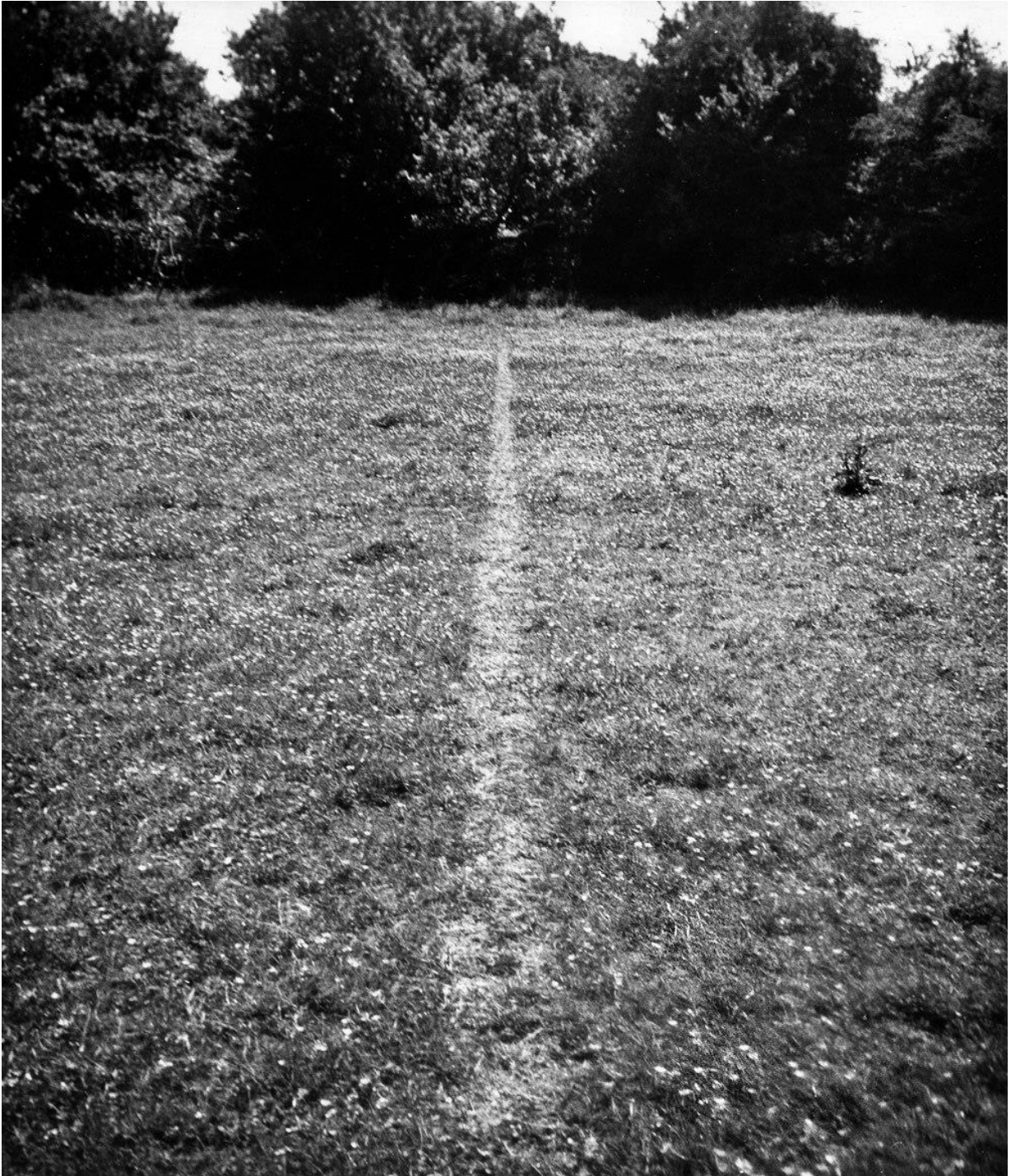
Richard Long , A Line Made By Walking , 1967, Wiltshire, Angleterre