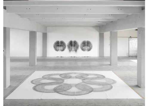
Tony Orrico, série des Circles