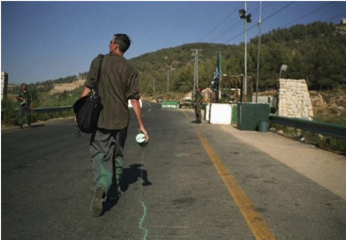
Francis Alÿs, The Green Line , Vidéo, 2004 – 2005

→ Revoir le corpus sur le geste plus autres artistes possibles :