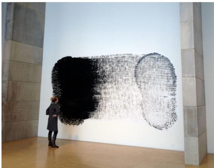
Evan Roth, Slide to Unlock , Impression sur vinyle, 2014, 600cm x 450cm. Peinture créée en exécutant des tâches de routine sur des appareils informatiques portables multi-touch.