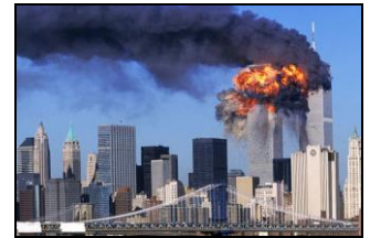
New York, 11 septembre 2001

• Le tiers-monde peine toujours à s'affirmer sur la scène internationale. L'ONU : tribune importante car réunit ttes les nations.