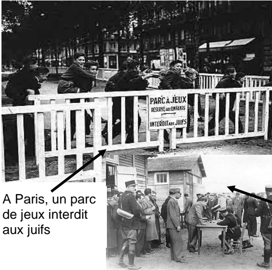
A Paris, un parc de jeux interdit aux juifs