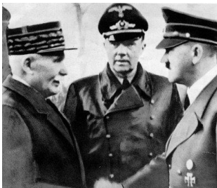
Rencontre de Montoire le 24 octobre 1940

1. D'après la photographie et le discours ci-contre, qui se rencontrent le 24 octobre 1940 à Montoire ? Quelle politique envisagent-ils ?