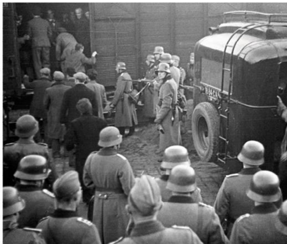
C La rafle des Juifs à Marseille le 27 janvier 1943.