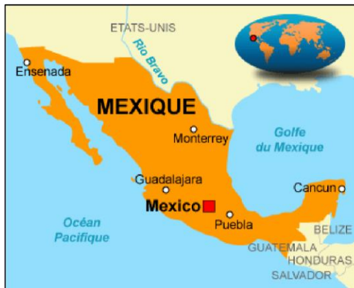
Doc 1 : Encart de localisation.