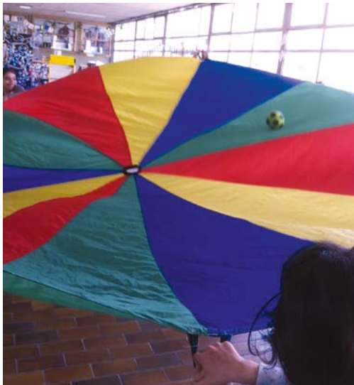
Toile de parachute.

Il existe toutes sortes de jeux coopératifs. On en trouve de nombreux descriptifs sur les sites de l'OCCE. J'ai également créé quelques jeux pour apprendre aux élèves à se déplacer dans l'espace (voir la fiche « Moi et les autres dans l'espace » en annexe) tout en respectant les autres, car en classe il arrive régulièrement qu'ils ne soient pas attentifs à leurs déplacements et à l'impact de leurs gestes sur les autres. Quels que soient les jeux pratiqués, les séances sont construites de manière à commencer par un temps calme dédié à la connaissance de soi et des autres, suivi d'un temps plus actif et plus engageant, puis enfin par un temps de retour au calme.