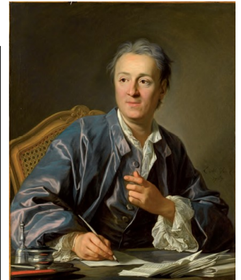
Diderot écrivain par Van Loo.

En 1773-1774, il séjourne en Russie à la cour de Catherine II, avec l'impératrice, il s'entretient sur tous les sujets qui préoccupent un monarque : le commerce, l'instruction des populations, les impôts, etc.