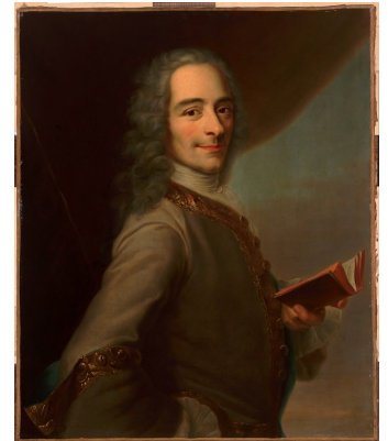
Voltaire tenant un exemplaire de la Henriade , Quentin de La Tour, 1736.

Il accepte l'invitation de Frédéric II de Prusse et part pour Potsdam (1750). En 1755, il s'installe en Suisse, où sera publié Candide (janvier 1759) et, enfin, dans un village français près de la frontière suisse, Femey (décembre 1758-février 1759). Il poursuit son combat en faveur de la tolérance ( Traité sur la tolérance , 1763 ; Dictionnaire philosophique portatif , 1764). Il meurt le 30 mai 1778.