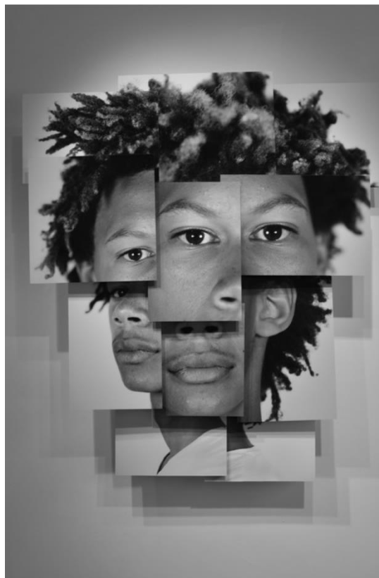
Brno del Zou, Latyr , 2013

2) Littérature, la métamorphose du réel : un art de l'alchimie des mots. La poésie transforme et crée une réalité poétique.