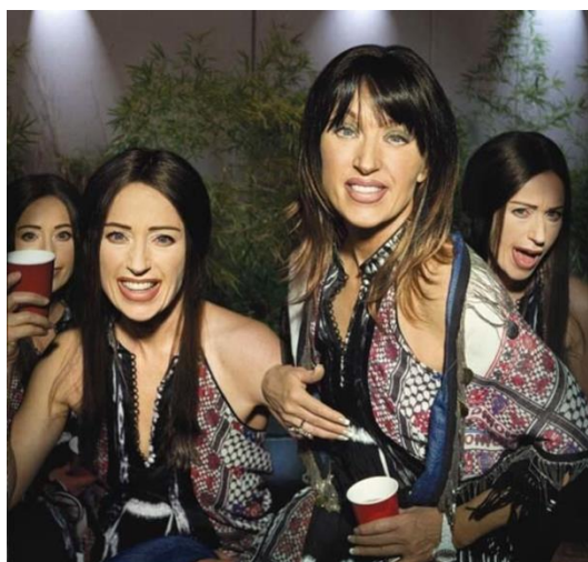
Cindy Sherman, Untitled , 1975 et 2007

1) L'autoportrait est une création de soi. L'image dénonce le caractère fictif des apparences et des contraintes liées à une norme.