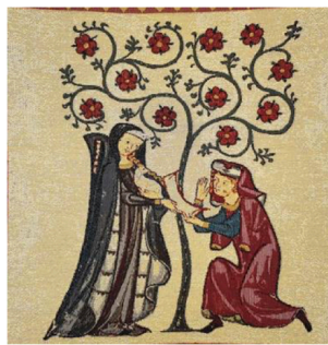
Von Obernburg , illustration, codex 1150, Bibliothèque de l'université de Heidelberg, Allemagne