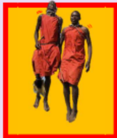
En sautant en l'air, comme les Massai !