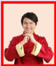
Comme en Chine