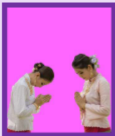
Comme en Thaïlande Le WAI