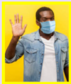
Avec un signe de la main