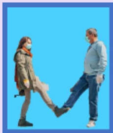
Le « cheek » avec les pieds