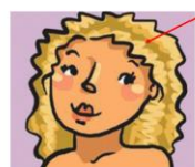
la tête la tête