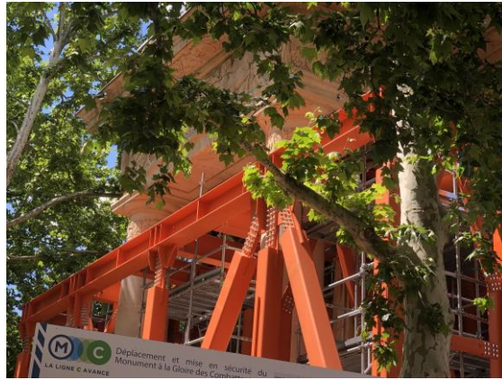
4- Une structure orange en métal autour d'un monument