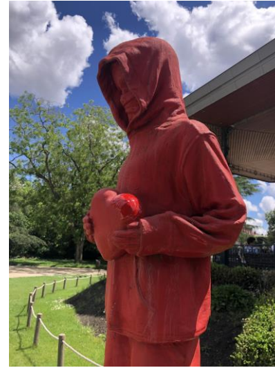
2- Un cœur rouge