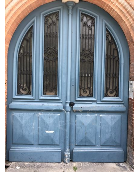
3- Une porte bleue