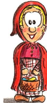
LE PETIT CHAPERON ROUGE