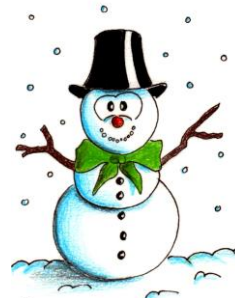
UN BONHOMME DE NEIGE