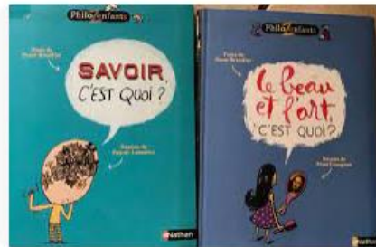
Activités à la maison Des livres pour nos philosophes en herbe | ...