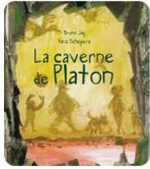
Les Editions du Cheval... Les Editions du Chev...