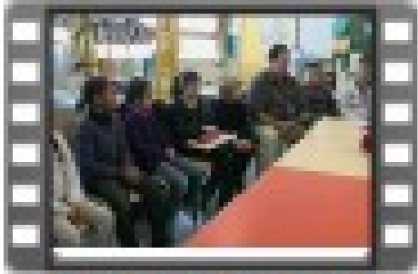
vidéo débat philo

Quelles règles ? Quelles étapes ? Quels rôles ?