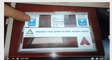
Un exemple d'aura contenant plusieurs overlays et actions (Claude Bodin, Académie de Poitiers)