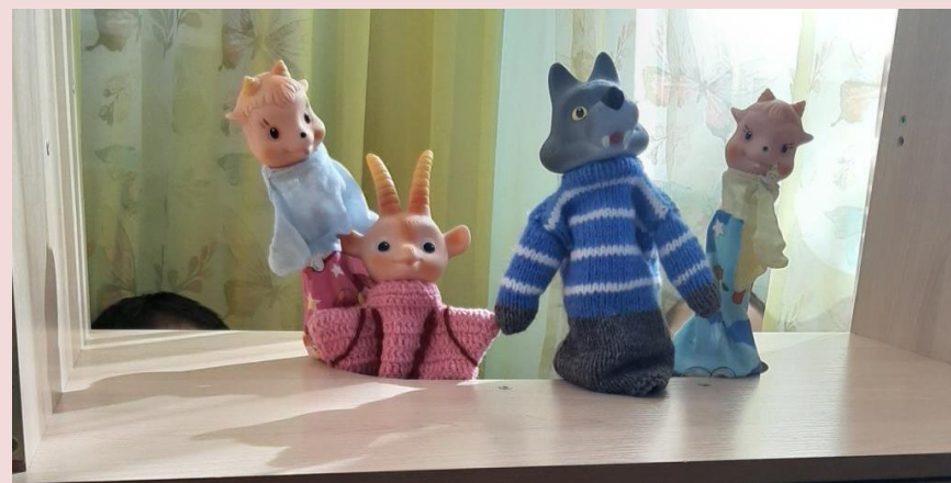
Сказка «Волк и семеро козлят»