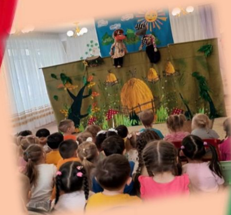
Фото отчёт о реализации проекта «Дети и театр»