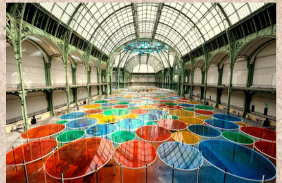
Franco fontana, photographe italien