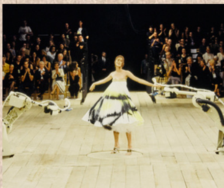
Défilé d'Alexander Mac Queen 1999