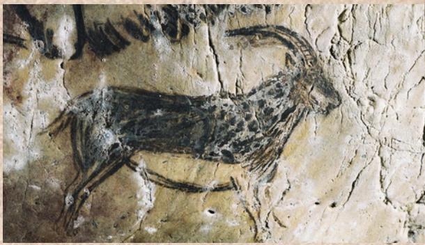
Détail des fresques rupestres de la grotte de Niaux en Ariège

L'outil peut être simplement l'accessoire d'une réalisation comme c'est le cas pour les dripping de Jackson Pollock ou un objet d'art à part entière, comme dans les machines à dessiner de Jean Tinguely.