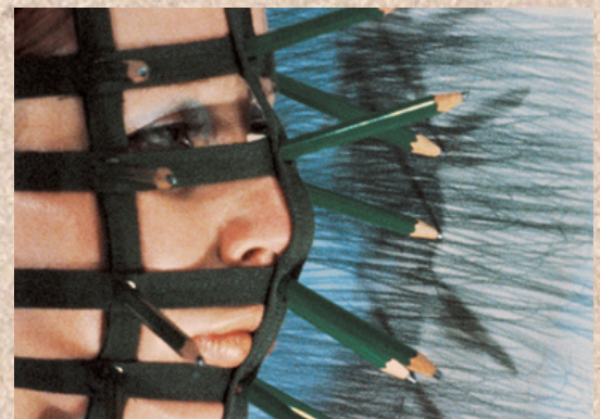
Rébecca Horn « Le masque aux crayons » 1972