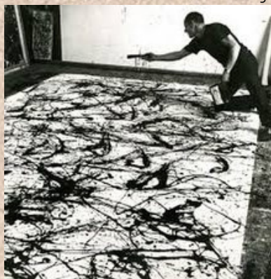
C'est en 1947 que Jackson Pollock abandonne l'utilisation classique du pinceau pour le dripping (projection de peinture sur la toile).