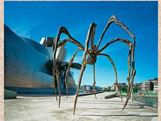
Louise Bourgeois, araignée installée sur le parvis du musée Guggenheim de Bilbao, Espagne, 1999.