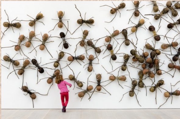
Rafael Gomezbarros, Hormigas, 2010

Vous trouverez une idée de mise en scène en extérieur , avec les 2 petites bêtes de l'équipe et réaliserez plusieurs photographies (2 ou 3, de différents angles de vue) + une courte vidéo avec l'application "Animate anything" sur iPad.