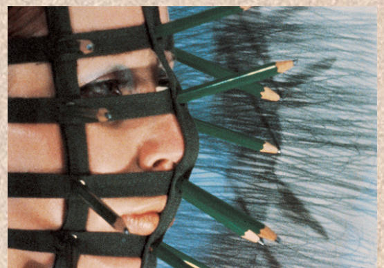
Rébecca Horn « Le masque aux crayons » 1972