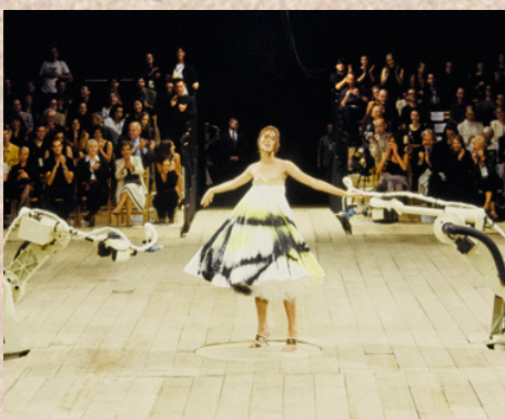
Défilé d'Alexander Mac Queen 1999

C'est en 1947 que Jackson Pollock abandonne l'utilisation classique du pinceau pour le dripping (projection de peinture sur la toile).