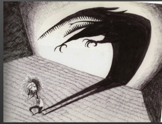
Illustration du réalisateur Tim Burton https://m.youtube.com/watch?v=mdBf3dlcc84