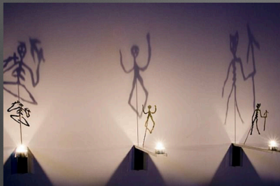
Christian Boltanski, "Le théâtre d'ombres", 1984

L'origine de l'art de l'ombre est très ancienne et certains la font remonter à la légende, racontée par Plin l'ancien, de Dibutate fille du potier corinthien Boutadès, dessinant, sur le mur, pour garder son image, l'ombre de son amant qui s'en va. Le mythe fut considéré au début XVIII e siècle comme l'origine de la peinture et donna lieu à de nombreux tableaux.