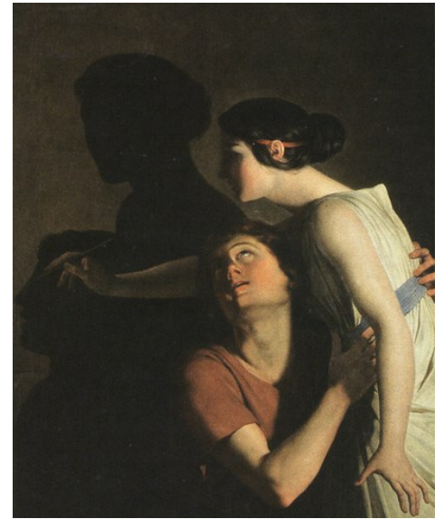
Joseph-Benoît Suvée, Dibutate ou l'Origine du dessin, 1791-1793, Groeningemuseum Bruges

L'origine de l'art de l'ombre est très ancienne et certains la font remonter à la légende, racontée par Plin l'ancien, de Dibutate fille du potier corinthien Boutadès, dessinant, sur le mur, pour garder son image, l'ombre de son amant qui s'en va. Le mythe fut considéré au début XVIII e siècle comme l'origine de la peinture et donna lieu à de nombreux tableaux.