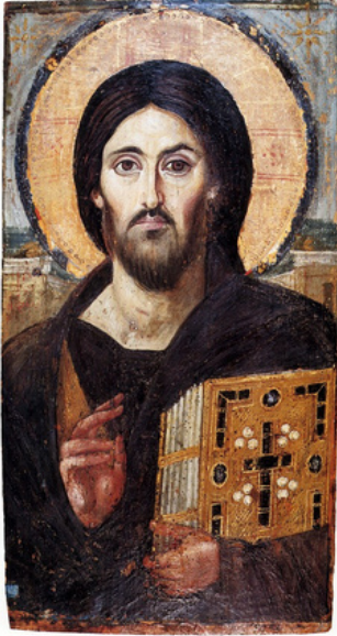
Christ pantocrator du monastère de Sainte Catherine du Sinaï, 6e siècle.

Le terme icône, du grec εἰκών, qui signifie image ou ressemblance, désignait à l'origine toute image religieuse, portative ou fixe, quelles qu'en soient la technique (peinture, mosaïque, marbre, ivoire, orfèvrerie, tissu, etc.)