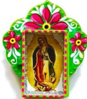
Autel mexicain de la vierge de Guadalupe