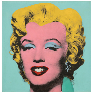
Andy Warhol, Marilyn, 1962