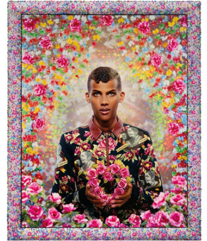
Pierre et Gilles