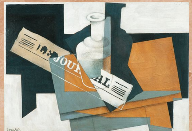
Pablo Picasso, La Bouteille de vieux marc, 1913