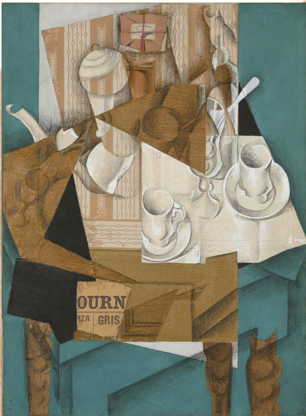
Juan GRIS, Le petit déjeuner, 1914

Peu à peu, le fond se transforme en forme, l'espace profond en espace plan. L'intégration des papiers collés dans les compositions graphiques change alors leurs surfaces et leur donne une nouvelle dimension.