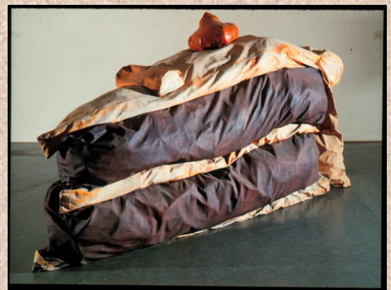
Claes Oldenburg, Floor Cake, 1962