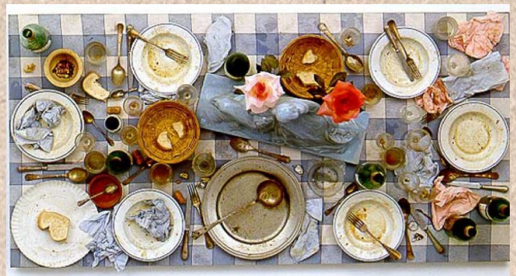
Les « tableaux piège » de Daniel Spoerri, artiste français appartenant au courant des Nouveaux Réalistes