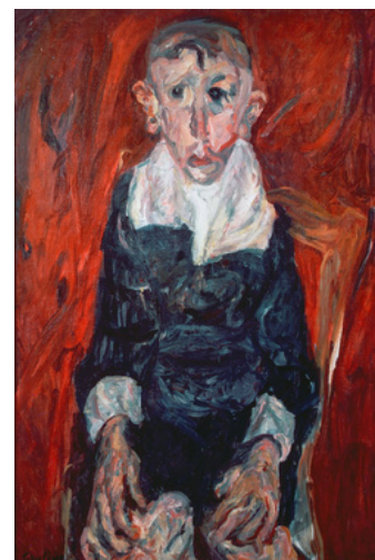
Chaim Soutine, L'idiote du village, 1921-22.

2) Mettre le dessin en couleur en fonction de la couleur qui désigne l'expression piochée. Effectuer des mélanges afin d'obtenir différentes modulations de couleurs.