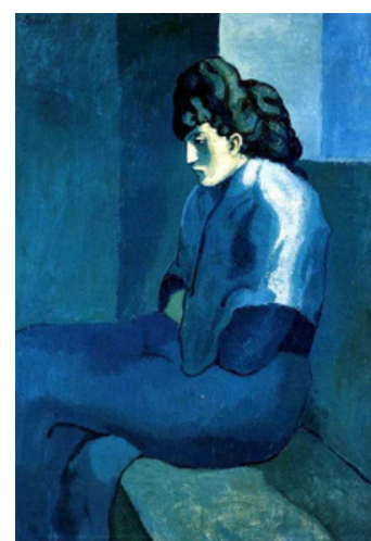
Pablo Picasso, La mélancolie, 1902.

Valeurs : degré de clarté d'une couleur. On assombrit une couleur en lui ajoutant du noir et on l'éclaircit avec du blanc.