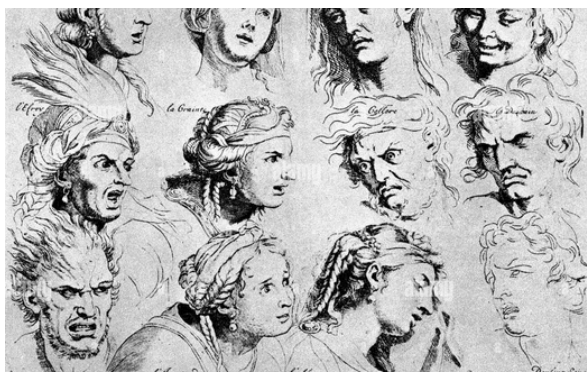
Charles le Brun, expressions, vers 1670

Art figuratif : L'art figuratif s'attache à la représentation du réel, en opposition à l'art abstrait.