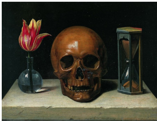
Philippe de Champaigne, Vanité, 1644