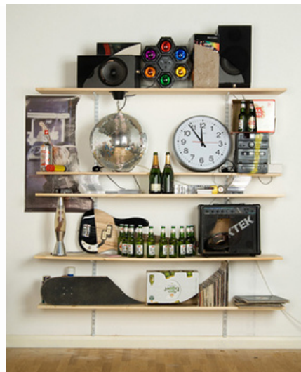
James Hopkins, Wasted Youth, 2006.