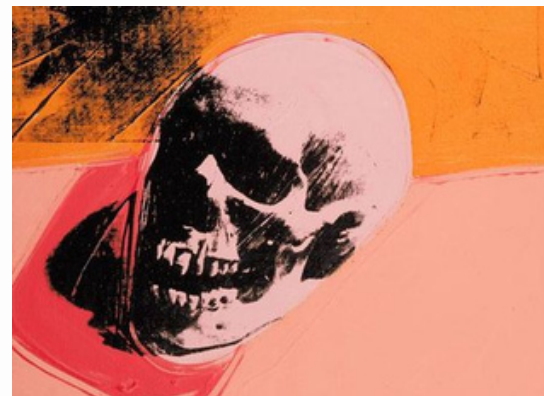
Andy Warhol, Skull, 1976