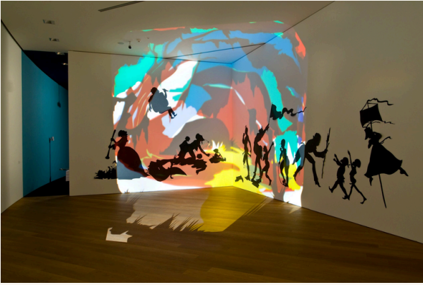
Kara WALKER, Darkytown rebellion, 2001