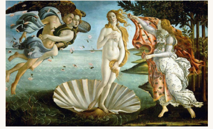
Sandro BOTTICELLI, La naissance de Vénus, 1485