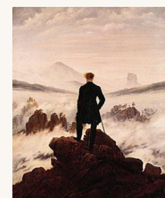
Caspar David FRIEDRICH, Le voyageur devant la mer de nuage, 1818