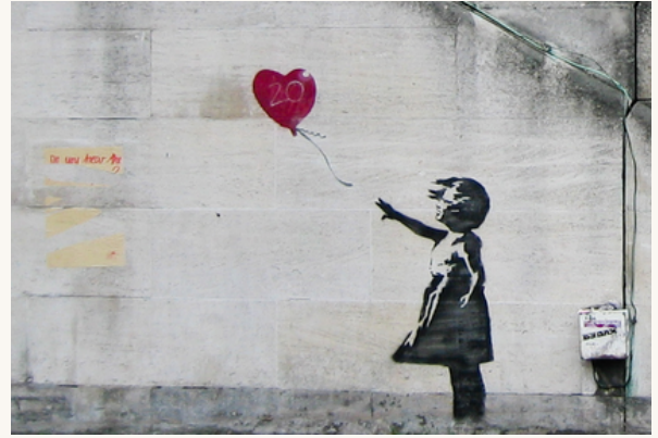
BANKSY, Girl with Balloon, 2002