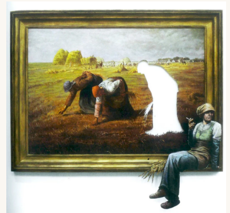
BANKSY, Les glaneuses, 2008