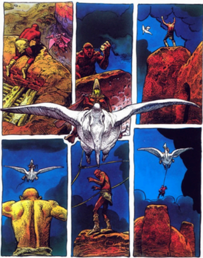
MOEBIUS, Arzach, 1976