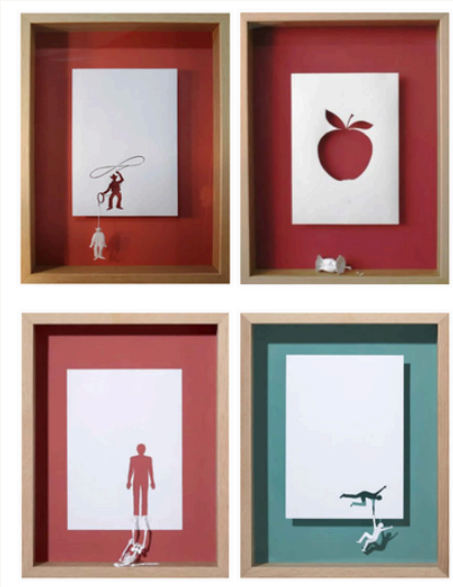
Peter CALLESEN, Cow-boy et autres, 2006