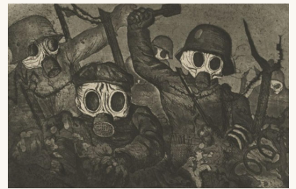
Otto DIX, La guerre, 1923