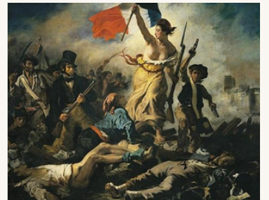
Eugène DELACROIX, La liberté guidant le peuple, 1831