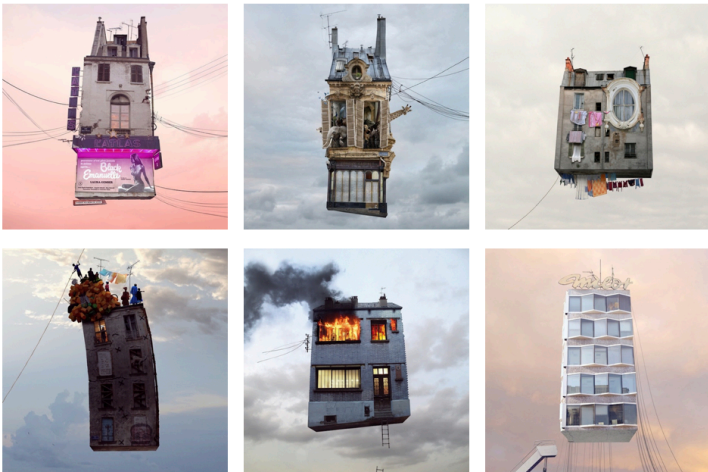
"Flying Houses" : Le surréalisme de l'architecture par Laurent Chénière