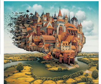
Les peintures surréalistes de mondes de rêve par Jacek Yerka