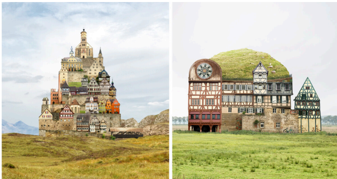
Les collages surréalistes de Mathias JUNG