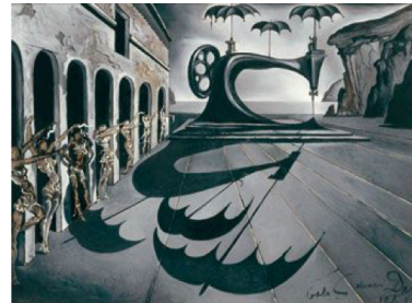
Salvador Dalí, Machine à coudre avec parapluies dans un paysage surréaliste, 1941