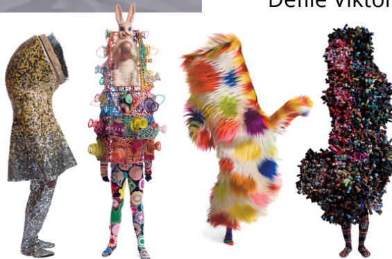
Costumes sonores de Nick Cave