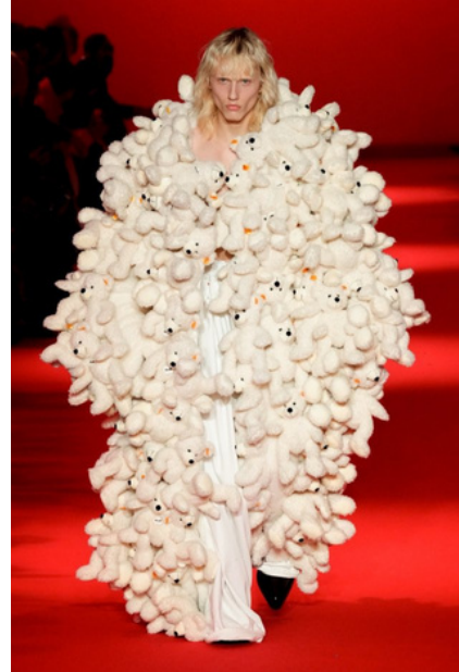
Jean Charles de Castelbajac, Teddy Bear Coat, 1980