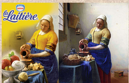
Vermeer, La laitière, 1658