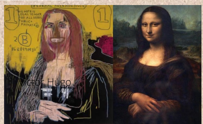
La Jondode, par JM Basquiat (originale Léonard De Vinci)