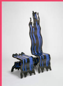
White Burshtroke de Roy Lichenstein (1965) / Le Brushstroke Chair and Ottoman (1985)