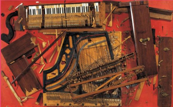
Arman, Chopin's Waterloo, 1962. Éléments de piano fixés sur panneau de bois, 186 x 302 x 48 cm.

Consigne : Rend visible les 6 musiques qui vont être diffusées. Mets en forme, en couleur, le morceau que tu écoutes mais attention: aucun éléments figuratifs ne doivent apparaître !