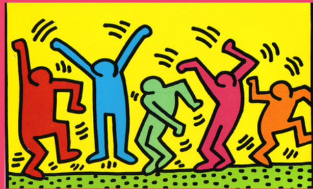
Keith Haring, sans titre, 1987. Acrylique sur toile.