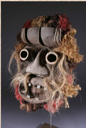
MASQUE DE GUERRE, AFRIQUE

Matériel : papiers (colorés ou non), bouchons, cartons, fils de fer, ficelle, matériaux de récupérations, etc.