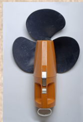
ROMUALD HAZUMÉ, UNTITLED, 2003