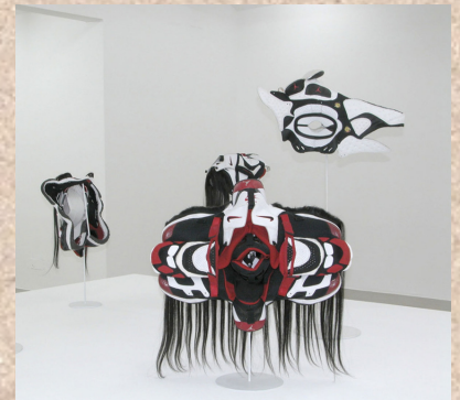
BRIAN JUNGEN, Prototypes for new understanding, masques cérémoniels inspirés de l'art amérindien, fabriqués à partir de Baskets Nike Air Jordan, 2003.