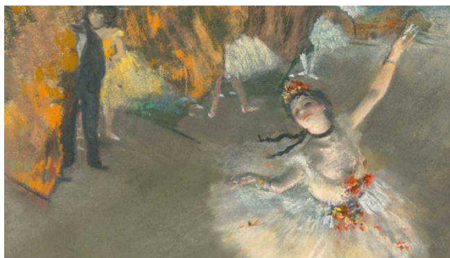
Edgar Degas, Ballet (détail), dit aussi L'Étoile, 1878, pastel sur papier maroufflé sur toile, 72 x 77,5 cm, Paris, musée d'Orsay