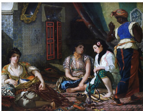
Eugène Delacroix, Femmes d'Alger dans leur appartement, 1834. Huile sur toile, 180 x 229 cm, Musée du Louvre, Paris.

Rehaut : dans un dessin ou une peinture, retouche d'un ton clair, servant à faire ressortir la partie à laquelle elle s'applique.