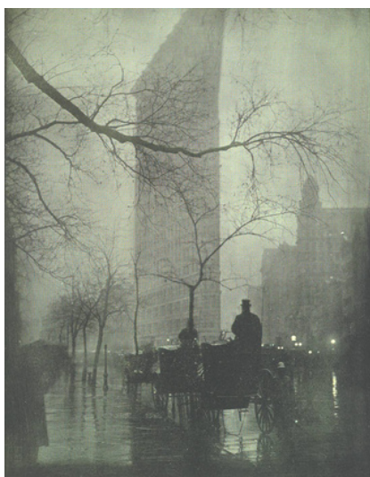
Edward Steichen, Le flatiron, le soir, 1906