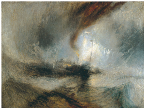
William Turner, Tempête de neige en mer, 1842. Huile sur toile, 91x122cm, Tate Gallery, Londres.

Mouvement : idée de déplacement, de changement de position d'un corps dans un espace dans un temps donné.