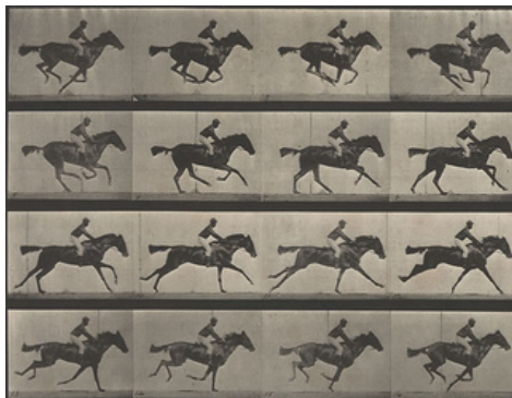
Edward Muybridge, Etude de la course du cheval, 1878. Tirages argentiques.